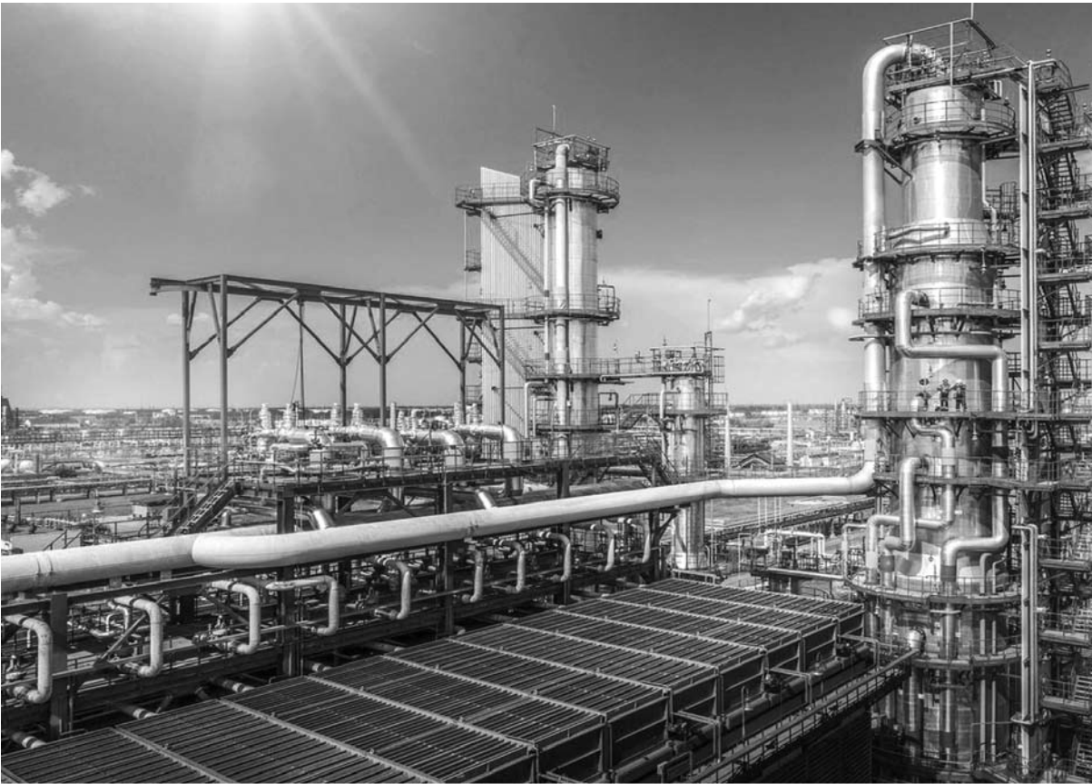
Эксперты не ожидают улучшения внешней конъюнктуры в 2026 году. Поэтому и с рентабельностью в абсолютном большинстве отраслей, ориентированных как на внутренний, так и на внешний спрос, ожидания не самые оптимистичные.

– Сложившаяся ситуация – следствие намечающейся стагнации. Снижение деловой активности из-за высокой