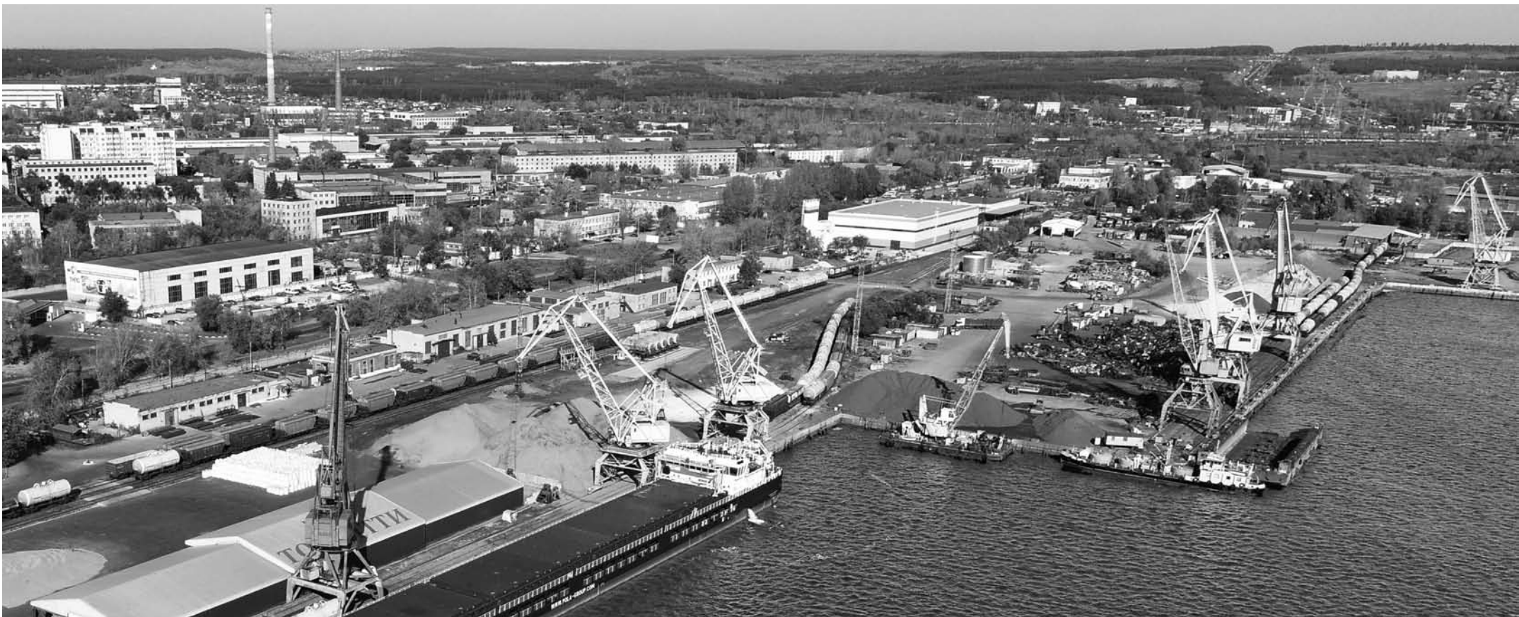
АО «Порт Тольятти» работает с любыми грузами – от зерна и металла до тяжеловесного оборудования, располагает флотом, причалами для судов класса «река–море» и, что самое главное, выгодным расположением в транспортных коридорах.

Основания для амбиций, на первый взгляд, есть. Как следует из отчета АО «Порт Тольятти» за