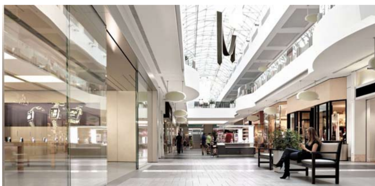
Участники рынка, оценивая перспективы, исходят из консервативных сценариев и закладывают в свои стратегии дальнейшее снижение трафика в торговых центрах и необходимость глубокой трансформации бизнес-моделей.

Если ранее под неторговые функции отводилось около 25% площадей, то теперь эксперты обсуждают пропорцию, близкую к 50 на 50. Таким образом, торговые центры претендуют на роль «третьего места» – пространства вне дома и работы.