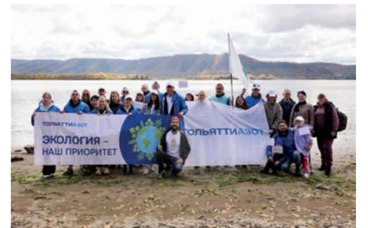
В 2025 году волонтеры ТООАза, члены их семей и учащиеся образовательных организаций Тольятти высадили в Ставропольском районе Самарской области более 9 тыс. хвойных деревьев и выпустили в Саратовское водохранилище около 12 500 мальков ценных пород. Акции экологической направленности будут продолжены и в дальнейшем.

сти населения, включая эковикторины для воспитанников детских садов и школьников. В 2025 году волонтеры ТООАза, члены их семей и учащиеся образовательных организаций Тольятти высадили в Ставропольском районе Самарской области более 9 тыс. хвойных деревьев и выпустили в Саратовское водохранилище около 12 500