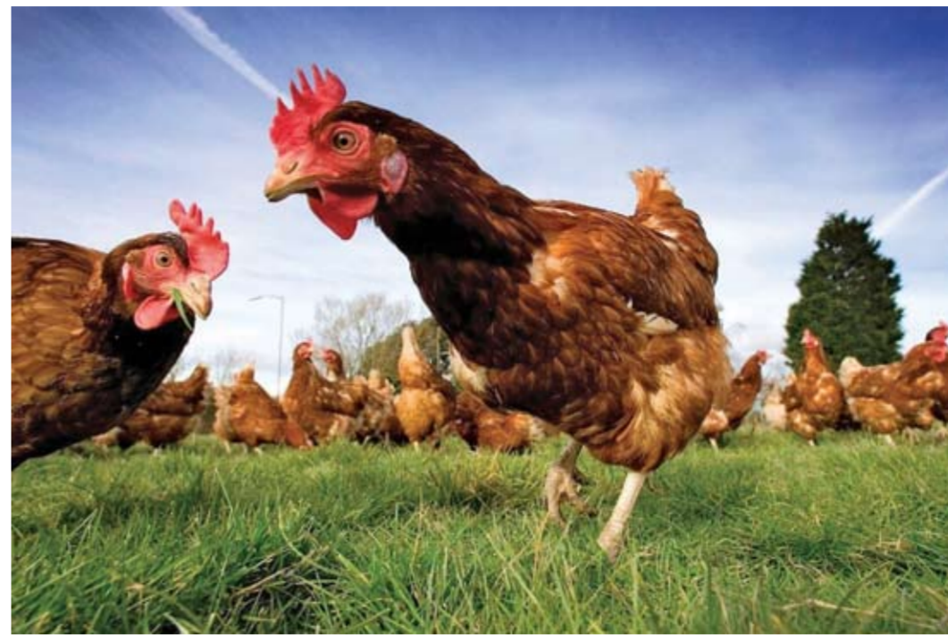
Проектной документацией предусмотрено строительство 108 корпусов для откорма бройлеров, инкубационного комплекса мощностью 52,7 млн яиц в год, а также убойного производства с пропускной способностью 10,5 тыс. голов в час.

Первая площадка – «Кабановка» в Кинель-Черкасском районе – ориентирована на формирование кормовой базы. Тут уже частично построена инфраструктура хранения и первичной переработки зерна: смонтированы металличе-