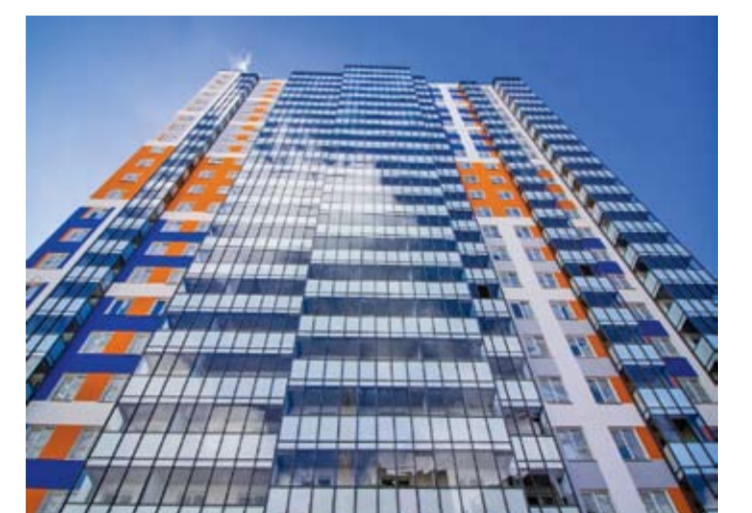
Пока тольяттинцы ждут обещанных аллей, на склоне над Волгой методично вырастает очередной ЖК, заслоняющий собой и воду, и горы, и память о французском летчике.

Чтобы понять градус общественного скепсиса, достаточно взглянуть на кадастровую карту. Центральная часть с номером 63:09:0105020:9 площадью более 20 гектаров имеет вид разрешенного использования, звучащий как поэма – «для строительства парка (сад скульптур Антуана де Сент-Экзюпери) и досуговой зоны». Однако вместо Маленького принца и роз на этой земле уже вполне осязаемо вырос остов капитального здания, напоминающего бизнес-центр, а арендатор территории, ООО «Событие», не спешит разбивать аллеи.