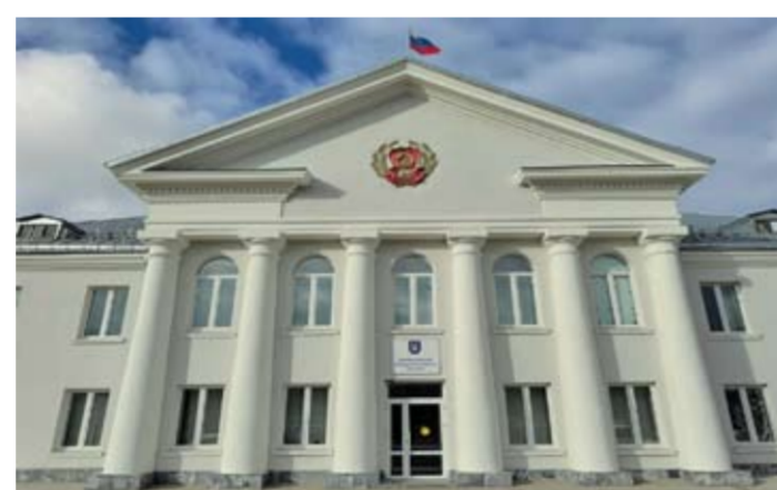
На 1 октября 2025 года кредиторская задолженность АО «Муниципальное управление жилищно-коммунального хозяйства» составляла 77,7 млн рублей, из которых 34,7 млн приходилось на обязательства перед акционером.

Существенным фактором давления на финан-