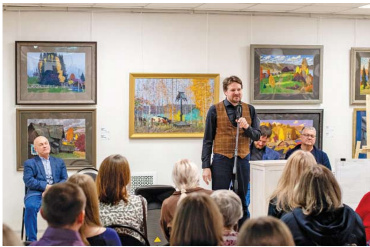
Еще есть немного времени, чтобы побывать в Музее Актуального Реализма на выставке «Русский Север»; она закончится 16 мая, когда многие музеи в нашей стране традиционно будут участвовать в международной акции «Ночь музеев».

Конечно, это аудитория более сложная, чем взрослые и пожилые люди, но мы работаем с ней с удовольствием: выстраиваем коммуникацию, стараемся взрастить своих зрителей на бу-