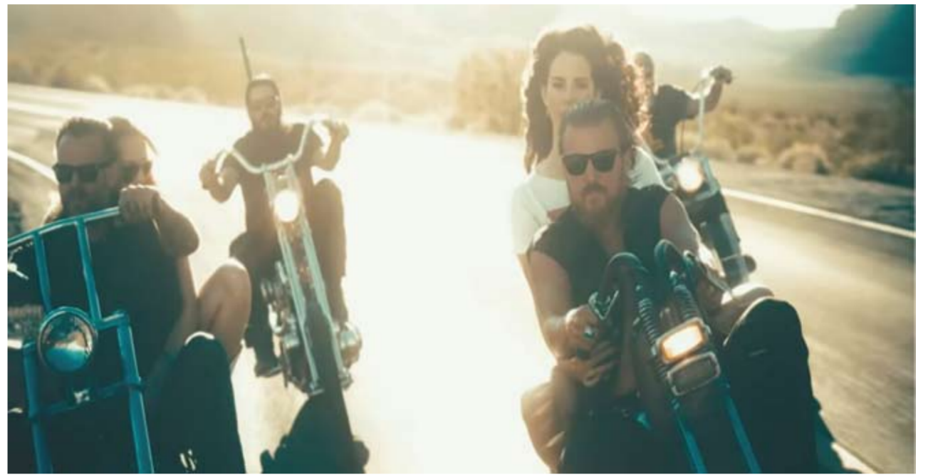
Власти столичного региона придумали, как бороться с опасными маневрами молодых людей на мотоциклах. Мособлдума приняла закон о запрете продажи горюче-смазочных материалов несовершеннолетним с сентября этого года. Тут правда есть неудобный вопрос: «А если купит взрослый друг?»

Закон вводит прямой запрет на продажу бензина, дизеля, газа и смазочных материалов лицам младше 18 лет. Исключение сделали для подростков, которые имеют официальное право управлять мопедами или легкими мотоциклами. Для этого нужно предьявить водительское удостове-