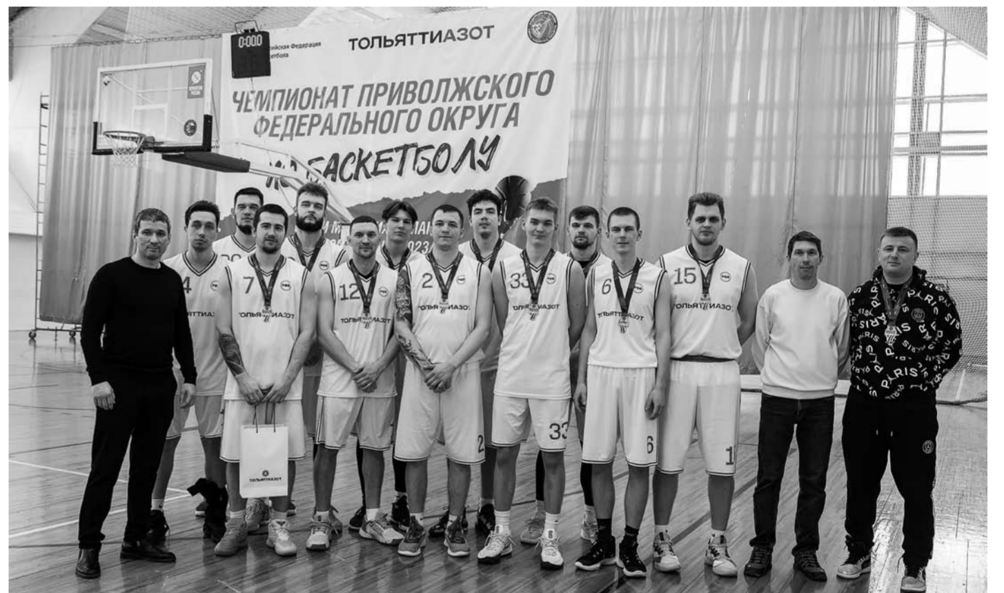
В первых двух матчах сборная Тольяттиазота победила. Игра с командой «Аврора» (г. Димитровград) закончилась со счетом 116:62, с «Авангардом» (г. Оренбург) – 115:74. В финале баскетболисты предприятия заняли второе место, уступив 15 очков спортсменам АВТОВАЗа (г. Тольятти). Тольяттиазот выступает спонсором и организатором турниров и чемпионатов по различным видам спорта, продвигая спорт в регионе присутствия компании.

«Тольяттиазот» выступил титульным спонсором чемпионата ПФО по баскетболу