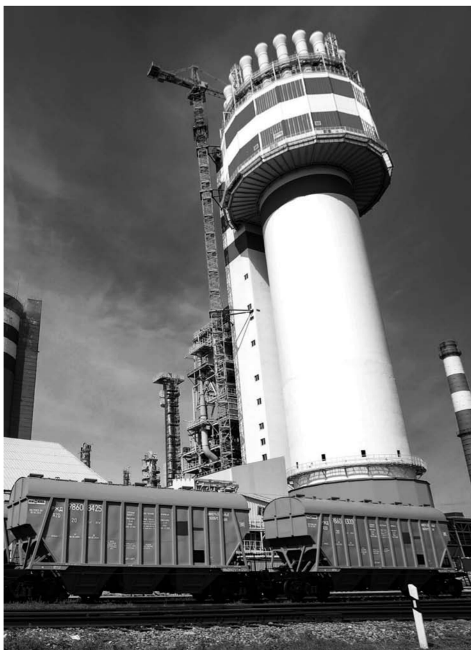
Железнодорожные весы предназначены для взвешивания подвижного состава с готовой продукцией, которая отправляется потребителю, – вагонов-минераловозов, вагонов-цистерн для перевозки аммиака и метанола. Оборудование способно взвешивать вагоны массой до 100 тонн.

Капитальный ремонт проходил в несколько этапов: демонтаж, заливка основания, монтаж опорных плит и установка усиливающего каркаса. Для устройства фундамента потребовалось 100 кубических метров бетона и 7 тонн арматуры. При проведении масштабных работ привлекались специальная техника – гидромолот на базе экскаватора. Железнодорожные весы запущены в эксплуатацию после поэтапной