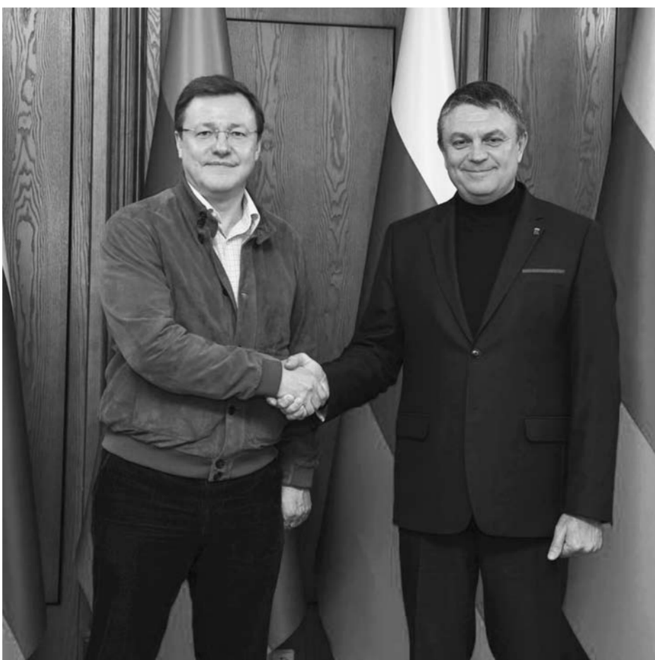
Глава Самарской области Дмитрий Азаров поблагодарил Леонида Пасечника за поддержку военнослужащих из Самарской области, дислоцированных на территории ЛНР.

около 25 тыс. жителей. Самарская область регулярно отправляет на эти территории гуманитарные конвои, которые привозят для жителей Сватовского района множество необходимых грузов – от повседневных продуктов и медикаментов до стройматериалов, которые использовались для ремонта пострадавших от обстрелов зданий, и музыкальных инструментов для детских школ искусств.