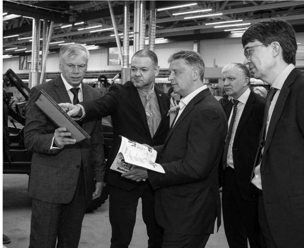
В структуру ПИШ «ГибридТех» вошли институт машиностроения, инновационно-технологический парк, научно-исследовательский институт прогрессивных технологий. Эти и другие подразделения вуза президент АО «АВТОВАЗ» Максим Соколов посетил во время визита в ТГУ.

АО «АВТОВАЗ» Максим Соколов. Он отметил, что вопрос взаимодействия с Тольяттинским госуниверситетом неоднократно