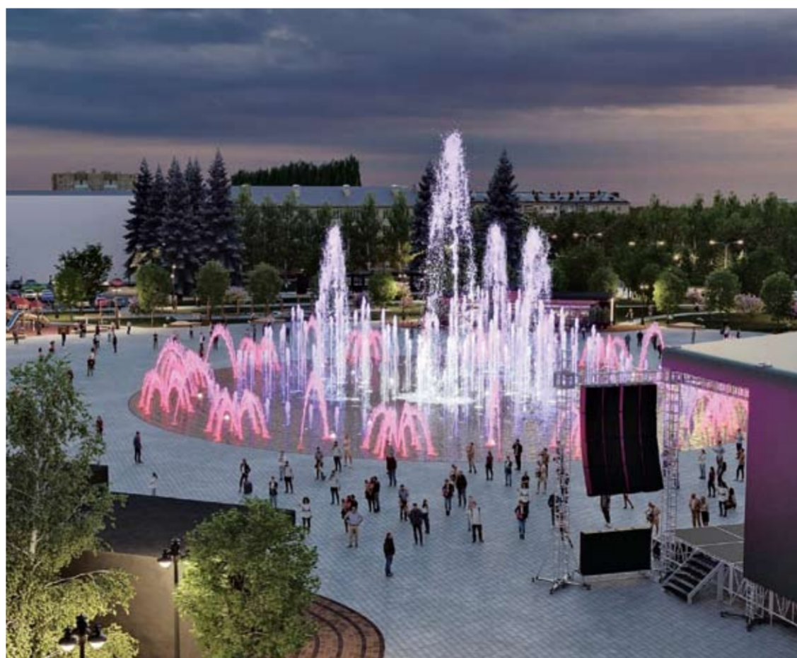
Главным украшением площади станет светомузыкальный мультимедийный фонтан. Его струи будут взлетать на 20 метров в высоту. Архитекторы добавили уникальную функцию: на водную поверхность с помощью проекторов станут выводить цветные изображения.

В этом году тольяттинцам предстоит выбрать из восьми объектов. На данный момент есть явный лидер – за сквер «Ромашка» в пятом квартале свои голоса отдали более 20 тыс. человек. Это компактное, но очень любимое местными жителями пространство.