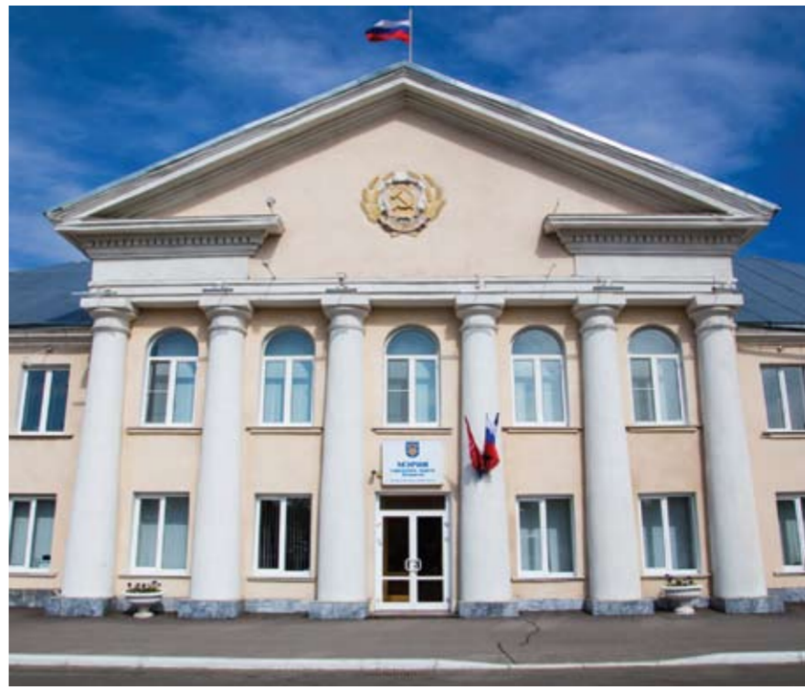
В структуре горадминистрации появились 37 специалистов по работе с населением. Их функционал почти полностью совпадает с обязанностями прежних управляющих микрорайонами.

Параллельно создается департамент энергетики, жилищно-коммунального хозяйства и при-