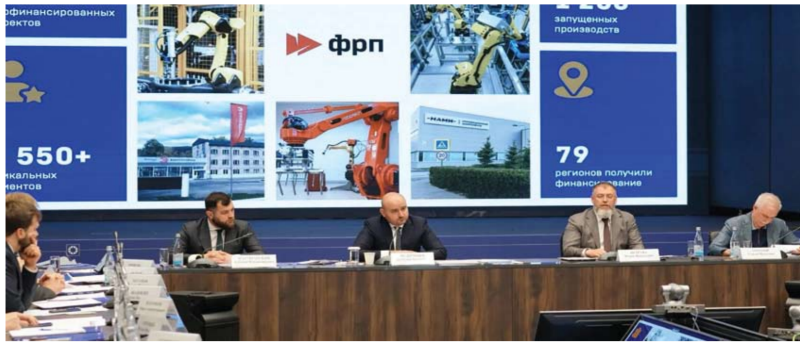
Форум объединил на одной площадке три ключевых события – заседание Госсовета, II Всероссийский конгресс региональных фондов развития промышленности и международный форум «ИРСК-2026».

словам, российская промышленность уже освоила выпуск широкой номенклатуры современных роботизированных систем. В стране налажено производство шарнирно-сочлененных, параллельных, линейных и цилиндрических устройств, а также популярных во всем мире SCARA-роботов, незаменимых для скоростной сборки. Среди особо востребованных моделей министр выделил консольные аппараты грузоподъемностью 45 кг, а также целую линейку манипуляторов в двух диапазонах: