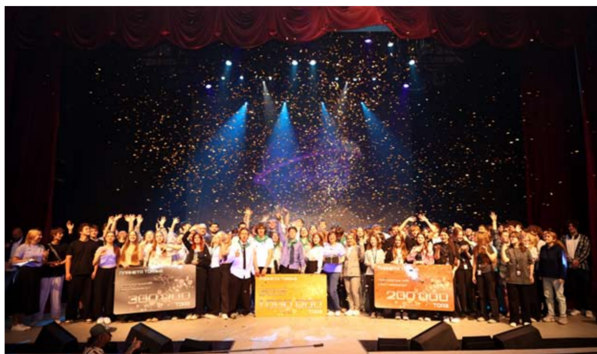
Завершающий этап третьего сезона «Планеты ТООАЗиЯ» и долгожданное торжественное награждение победителей прошли в ДК «Тольяттиазот».

«В новом сезоне проекта «Планета ТООАЗиЯ» можно выделить несколько ключевых особенностей. Во-первых, красной нитью через все этапы будет проходить тема профессий ТООАЗа. Во-вторых, к третьему сезону география наших участников вышла за пределы Тольятти – к нам подключились образовательные учреждения сел Васильевка и Зеленовка. В-третьих, значительно