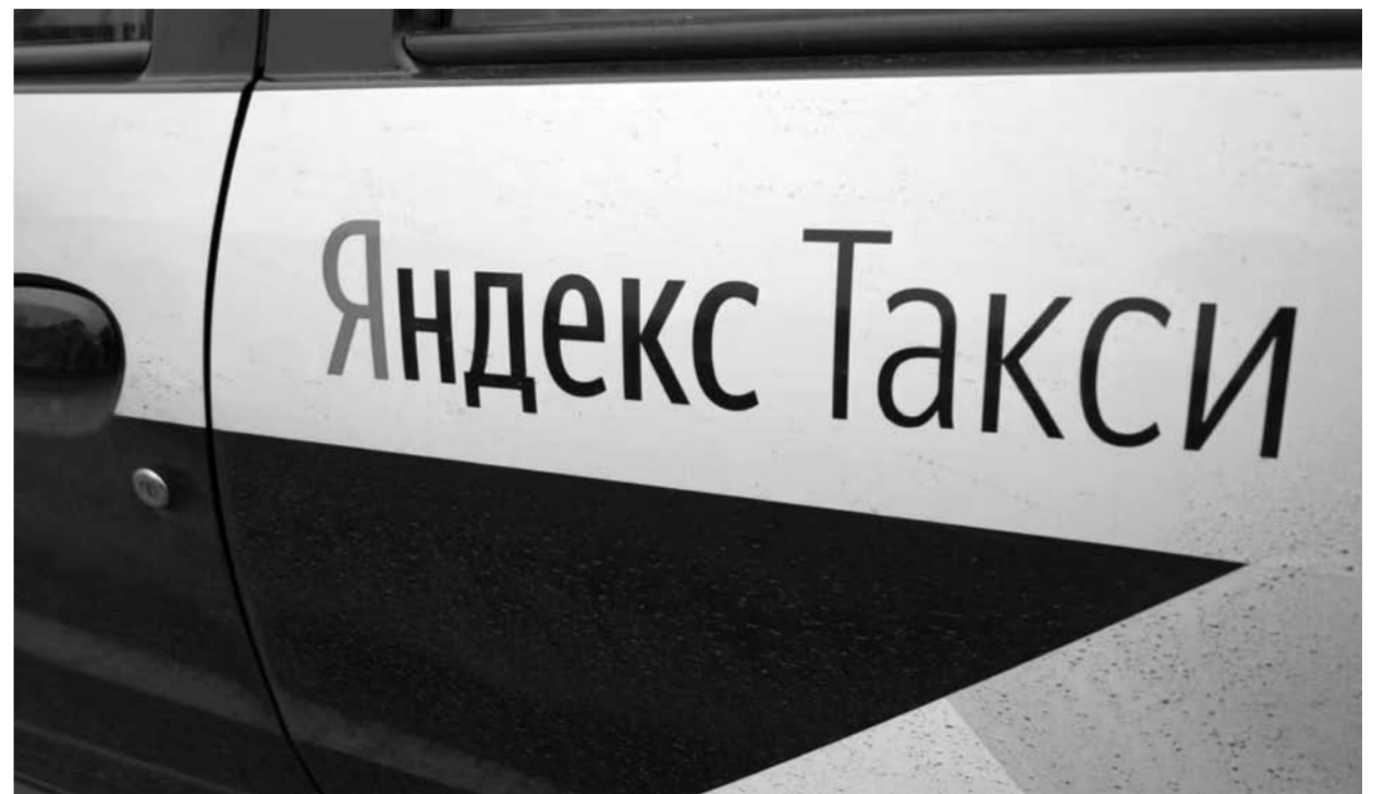
❗ Недостаток водителей в такси – это проблема всех российских регионов. На данный момент дефицит работников составляет более 130 тыс. человек.

можности работать в такси. В 2024 году в Самарской области для них были введены ограничения по трудоустройству. С 24 февраля они не могут работать по патенту в сфере общественного транспорта, такси и образования. Даже те из «иностранных специалистов», кто не покинул Россию после трагических событий в «Крокус-Сити» в марте 2024 года, предпочитают выбирать строительные площадки города и региона, на которых так же сильно не хватает работников.