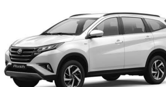
❗ Если дубайская история будет рыночная, то актуальной линейке LADA в лице Granta, Vesta и семейства NIVA придется несладко. Ведь бороться им предстоит в честной рыночной игре вот с этими ребятами.

лице Granta, Vesta и семейства NIVA придется несладко. Ведь бороться им предстоит в честной рыночной игре вот с этими ребятами.