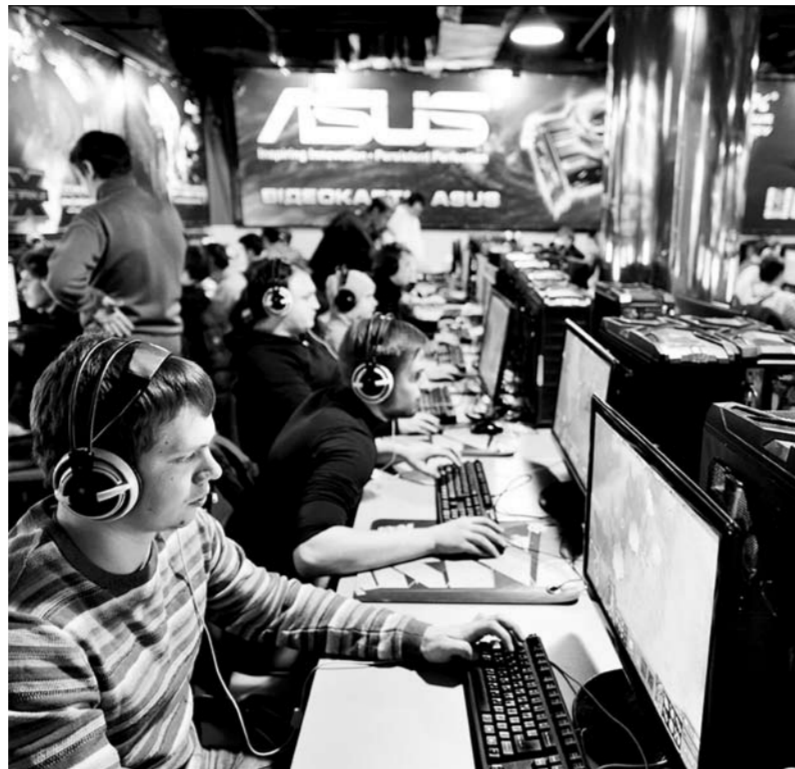
В этом году соревнования пройдут по четырем видам программы: Dota 2, League of Legends, FIFA 17 и Hearthstone. Общий призовой фонд составит 7 млн рублей: 3,2 млн рублей – в Dota 2, 2,5 млн в League of Legends и по 650 тыс. в FIFA и Hearthstone.

Киберспортсмены совсем не бледные ботаники, которые пытаются заменить реальную жизнь виртуальной, а молодые перспективные ребята, которые зарабатывают на том, что действительно любят: персонально