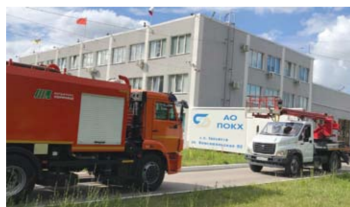
При изначально установленном плане в 1,7 млн рублей АО «ПО КХ г.о. Тольятти» отчиталось о рекордной прибыли в сумме 77 млн.

Итоги работы АО «ПО КХ г.о. Тольятти» можно было оценить весной 2024 года, во время паводка: инфраструктура успешно справилась с приемом талых вод.