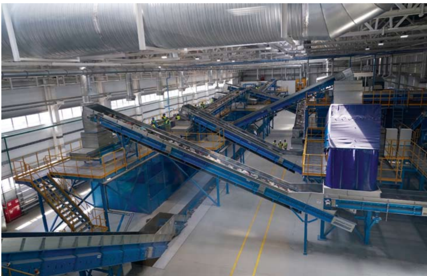
На совещании была утверждена дорожная карта, которая предусматривает комплексный подход и взаимодействие с Российским экологическим оператором в решении вопросов и реформировании системы обращения с ТКО.

Важно отметить, что в новом производственном комплексе используется 78 % отечественного оборудования, которое поставила российская компания «ЭкоМашГрупп». Речь идет об основных производственных мощностях. Таким образом, можно говорить о том, что при эксплуатации в