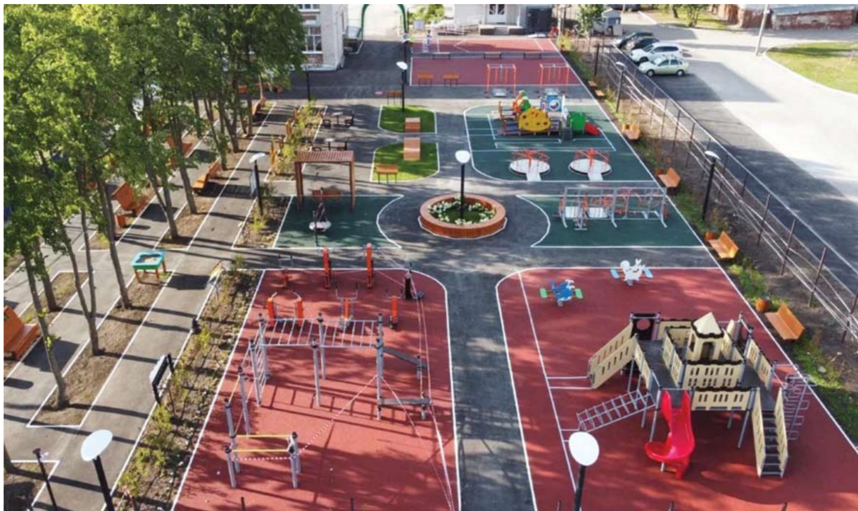
«Татнефть» уделила большое внимание особым детям. Летом 2023 года на территории МБУ «Школа № 26» открылся инклюзивный спортивно-развлекательный парк под названием «Невозможное возможно». В 2022 году этот проект также стал победителем конкурса грантов «Татнефти» и был реализован в партнерстве с администрацией Тольятти.