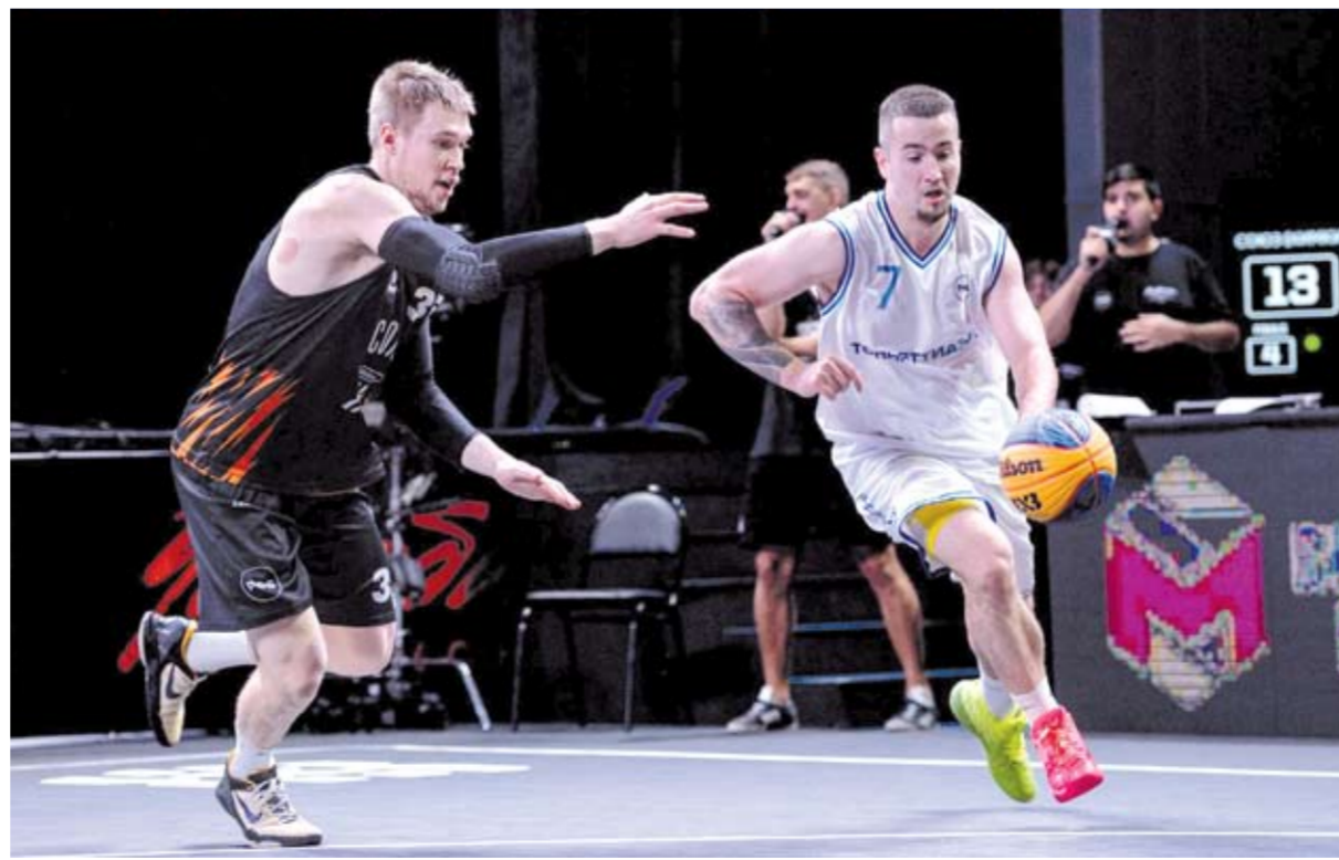
На протяжении многих лет работы «Тольяттиазот» реализует собственные социальные программы и поддерживает начинания местных властей, помогая городу стать благоустроенным и комфортным для проживания.

подготовка к открытию профильного класса.