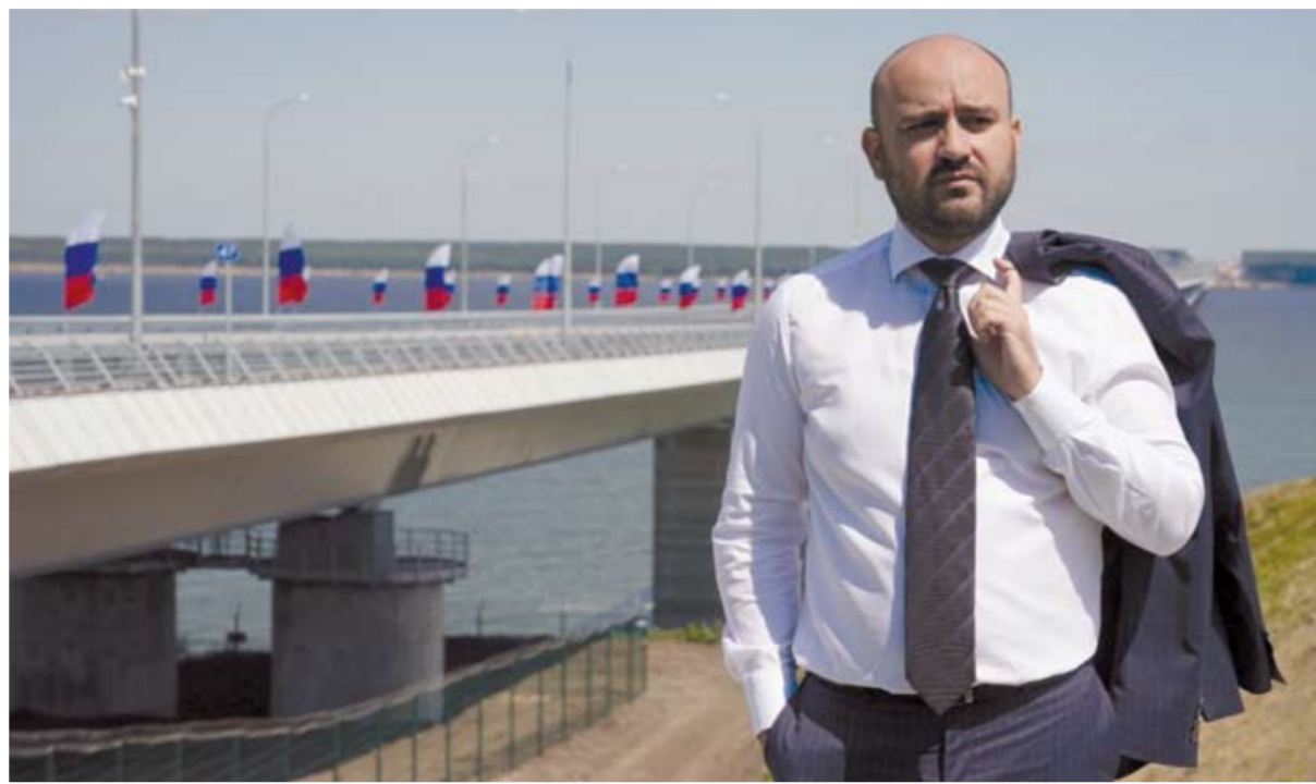
Автомобильный мост через Волгу – первый в регионе, он имеет длину более 3,7 км и вошел в десятку самых протяженных инженерных сооружений России. Уже первая неделя эксплуатации моста и новой автотрассы наглядно показала, насколько была необходима нашей области эта транспортная артерия.

ручению, которое вы дали в 2017 году, данная дорога попала в комплексный план развития магистральной инфраструктуры Российской Федерации. Порядка 100 километров новой безопасной дороги, а также уникальное событие для нас всех – первый мост через реку Волгу в Самар-