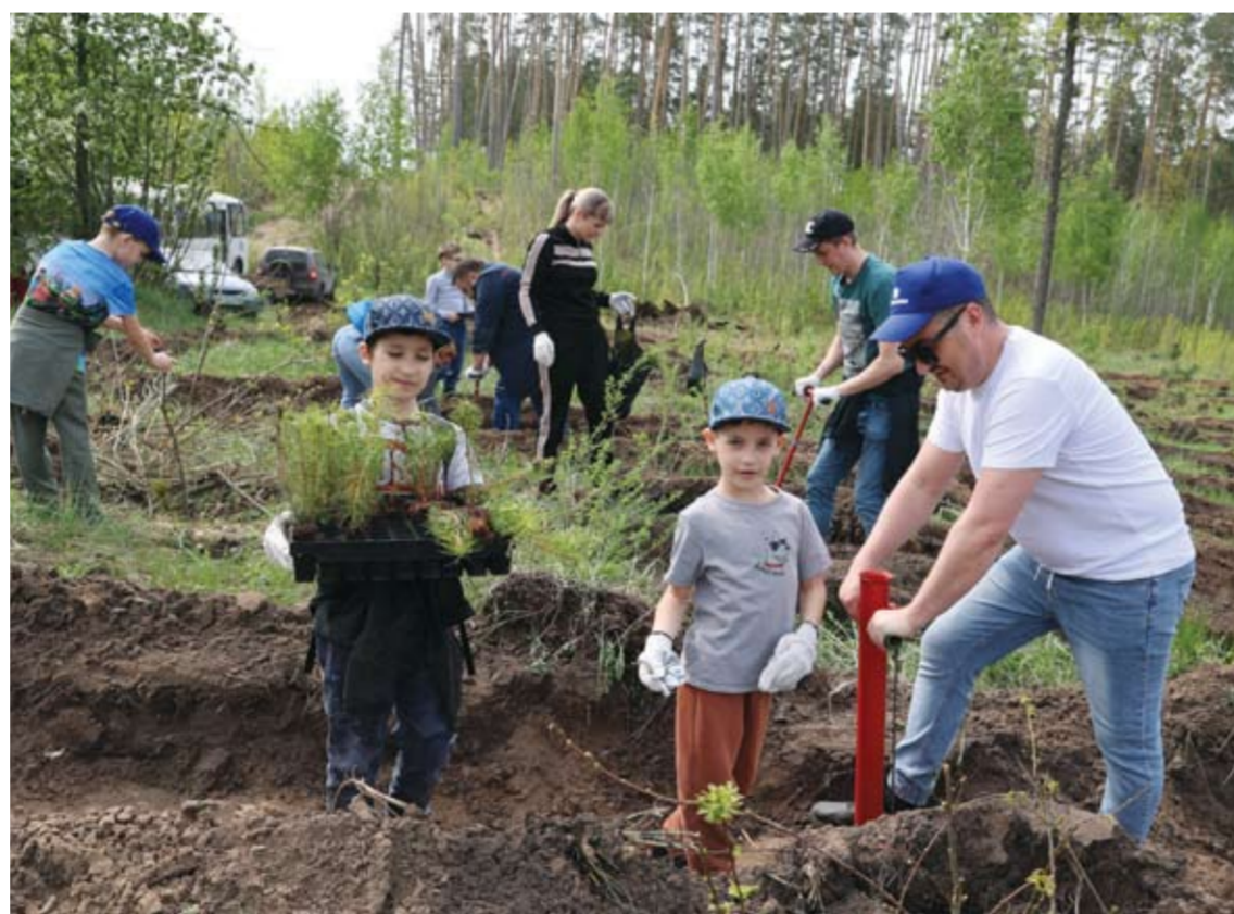
С 2012 года «КуйбышевАзот» участвует в восстановлении тольяттинского леса, пострадавшего от пожаров. Усилиями компании и ее работников удалось восстановить 57 га леса, высадив порядка 300 тыс. деревьев с последующим уходом на протяжении трех лет.

Поддержка детского спорта – одно из приоритетных направлений в реализации социальных программ «КуйбышевАзота». С 2012 года компания совместно с городским благотворительным фондом реализует программу «Дворовый спорт», благодаря которой обычные дети могут заниматься спортом рядом с