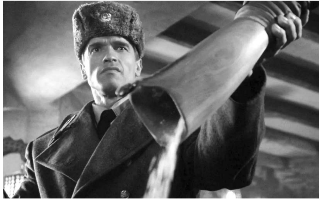
Слабоумие и отвага — житель Уфы, которого лишили прав управления транспортным средством, пришел в городской полк ДПС за разрешением на выдачу автомобиля с пакетом наркотиков в кармане. Ранее его задержали в состоянии опьянения.

оформления изъятия документа в помещении КПШ. «В это время брат задержанного пересел на водительское сиденье и переставил автомобиль, как пояснил позднее, чтобы тот не мешал проезжающим», — сообщает областной главк. Эти манипуляции показали подозрительными сотруднику полиции, несущему службу возле здания КПШ, и он попросил мужчину предъявить документы на право управления.