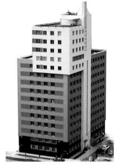
Плаза. Отрис. Реклама