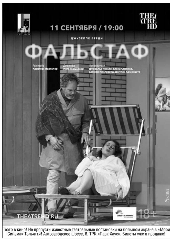
Театр в кино! Не пропусти известные театральные постановки на большом экране в «Мори Синама» Тольятти! Автозаводское шоссе, 6. ТРК «Парк Хаус». Билеты уже в продаже!