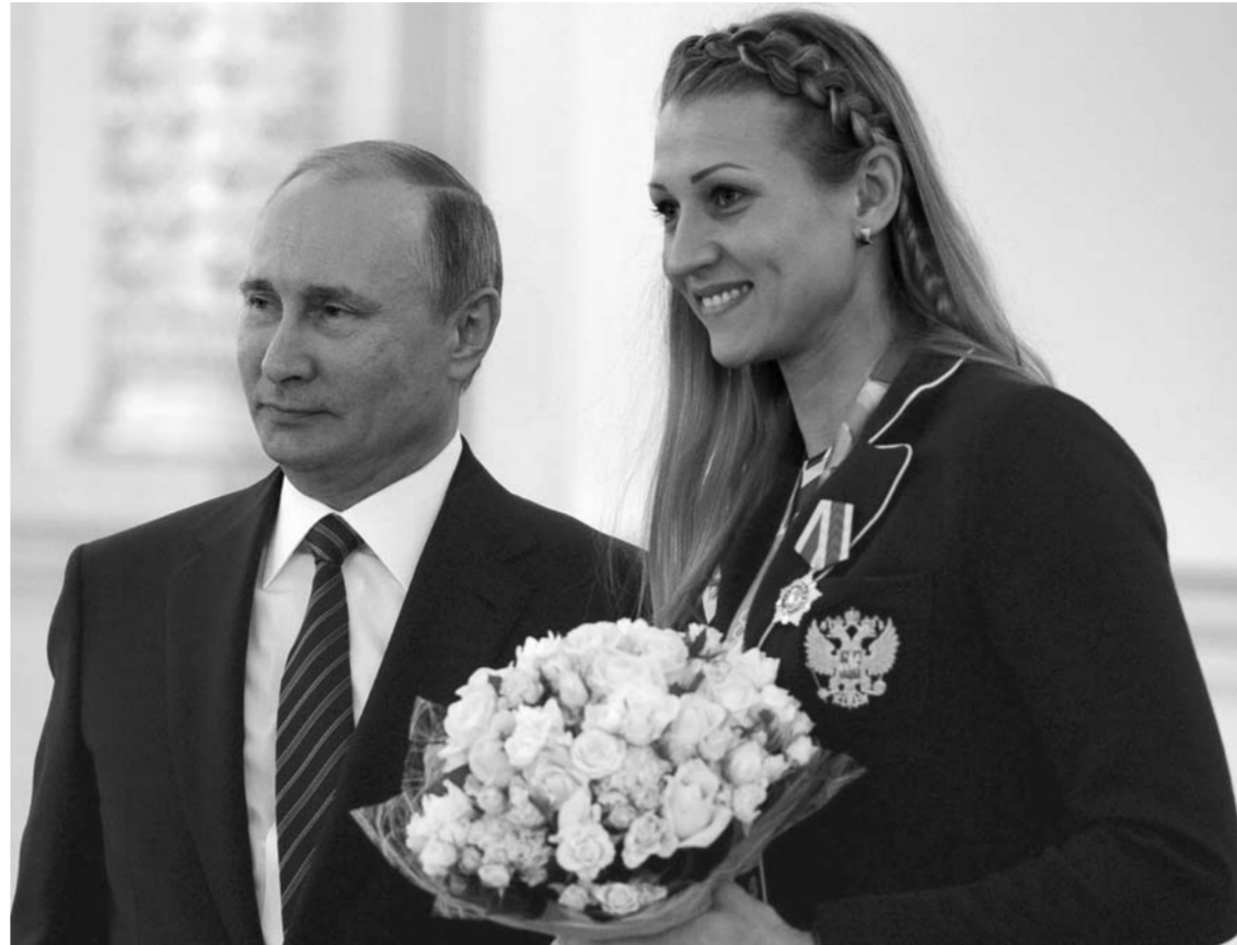
Игроки «Лады» в нулевые замелькали на президентских приемах. Ничего удивительного – за пару десятилетий на международной арене они завоевали дюжину медалей, включая четыре мировых «золота», одно олимпийское, а также два олимпийских «серебра».

Ставки в российском женском гандболе резко выросли с приходом бизнесменов из списка