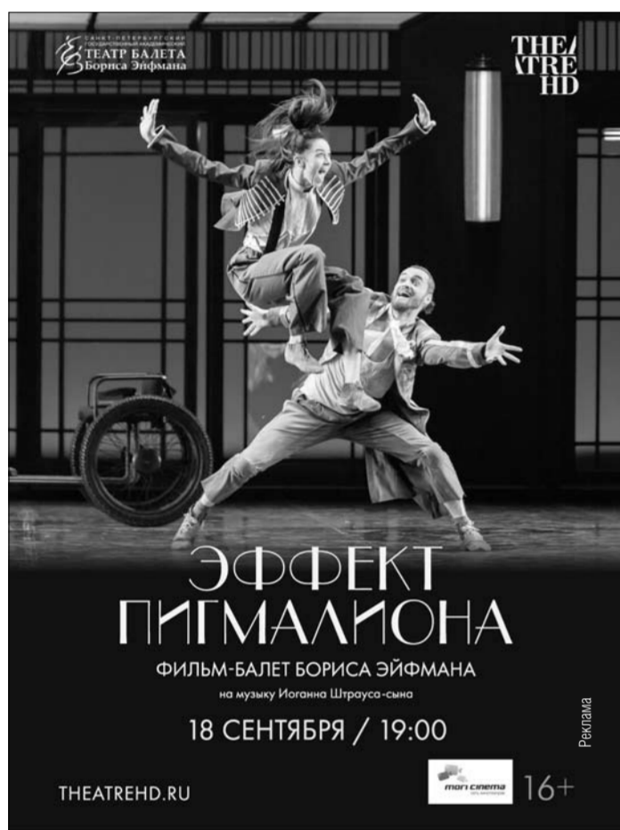
Театр в кино! Не пропусти известные театральные постановки на большом экране в «Мори Синама» Тольятти! Автозаводское шоссе, 6. ТРК «Парк Хаус». Билеты уже в продаже!