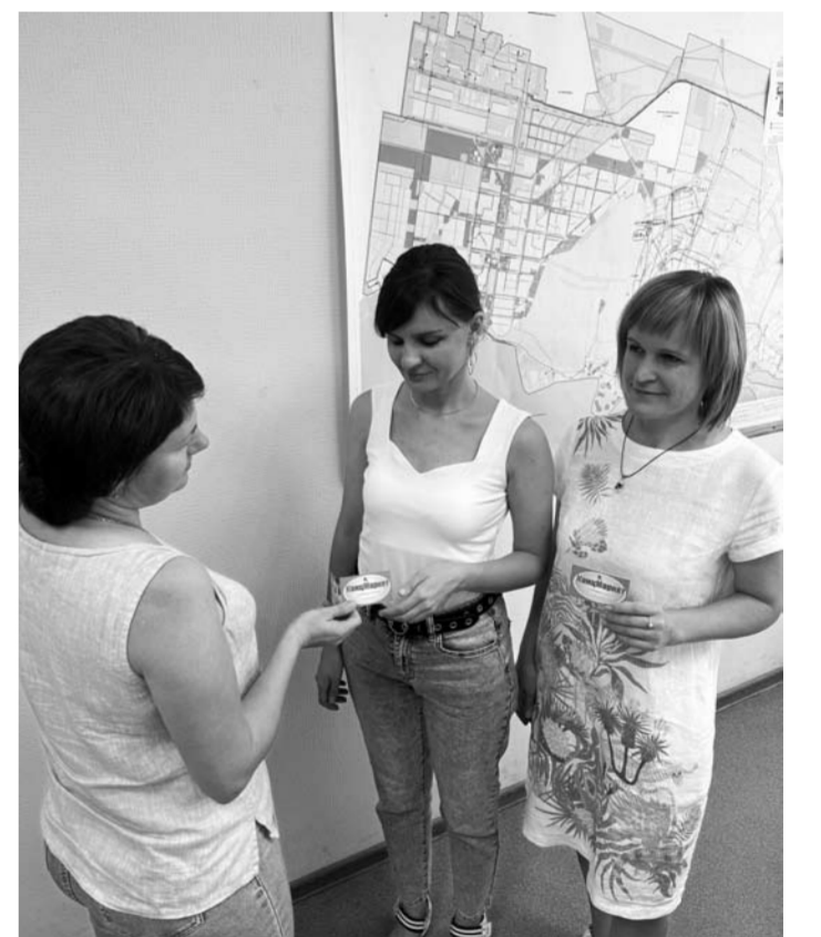
Взаимодействие работников и АО «ПО КХ г. о. Тольятти» ведется на основе принципов социального партнерства в сфере труда, коллективно-договорного регулирования социально-трудовых отношений, уважения взаимных интересов, равноправия, соблюдения трудового законодательства, с учетом оптимального баланса интересов сторон для эффективного решения задач, стоящих перед акционерным обществом.