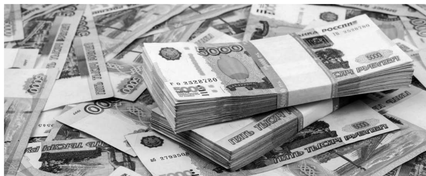
В Тольятти жилье выросло в процентном соотношении больше, чем в Самаре: в июне 2020-го стоимость квадратного метра в многоэтажке составляла менее 50 тыс. рублей, а в июне этого года превысила 130 тыс.

было выдано почти 49 тыс. кредитов на общую сумму 210,1 млрд рублей. В июле выдача жилищных займов сократилась вчетверо как в количестве, так и в денежном выраже-