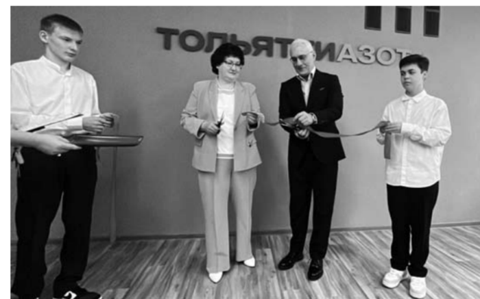
В четырех школах города успешно действуют инженерно-технические классы ТООЗа с углубленным изучением химии, физики и информатики: в гимназии № 35, школе № 41, лицее № 60 и кадетской школе № 55. В новом учебном году к ним присоединилась школа № 25 поселка Поволжский.

В начале учебного года при поддержке «Тольятти-азота» в МБУ «Школа № 25» открылся новый инженерно-технический класс (ИТК), а пять школ города получили «ТООЗбуки» — учебные пособия для первоклассников, которые в игровой форме знакомят учащихся с основами химии и производственной деятельностью предприятия. Кроме этого, ТООЗ поддерживает и дошкольные учреждения. Так, на территории детского сада «Сосенка» в рамках программы «Химия добра» был открыт музыкальный городок.