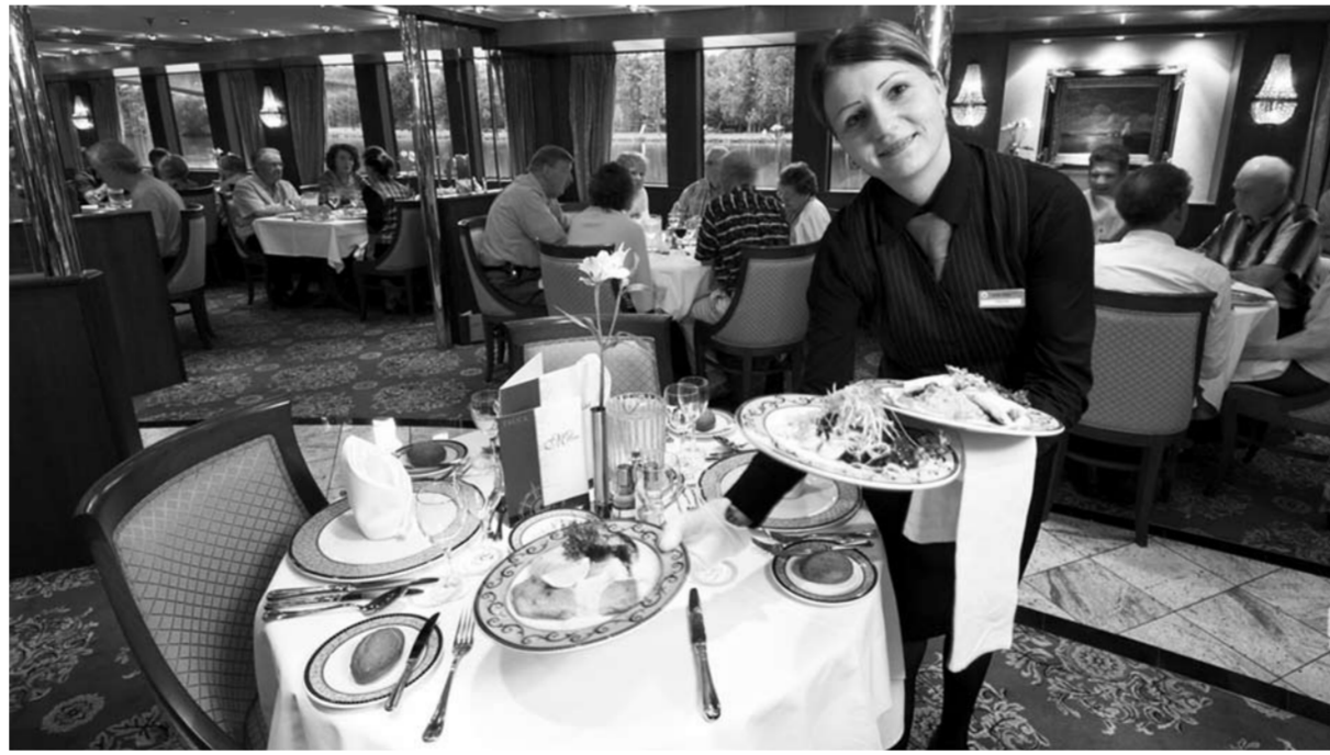
Чтобы устроиться на вакантное место, требуются неплохое знание языков, денежные вливания и даже «паспорт моряка». Препятствия отпугнут большинство людей. Мы же расскажем о тех тольяттинцах, которые не побоялись трудностей и «взяли на бордаж» палубы российских траулеров и американских туристических лайнеров.

Рабочий день фотографа на судне порой начинается в семь утра и заканчивается в 23.00, и