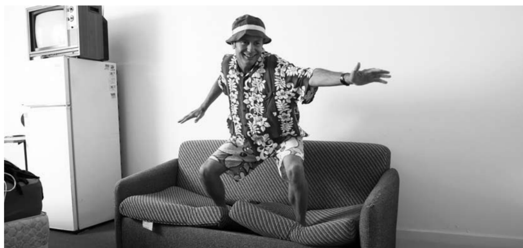
Дословно couchsurfing переводится как «диванный серфинг». Гостеприимных хозяев называют хостами, а путешественников – серферами. Сейчас в сообществе 14 млн человек из более чем 200 тыс. городов.

В целом идея, безусловно, увлекательная: можно неплохо сэкономить на проживании и узнать много интересного о настоящей жизни в той или иной стране, местных жителях, их традициях и интересах. Конечно, есть и сложные моменты, которые стоит учесть. Например, знание языка (хотя бы только английского) будет плюсом, как, в принципе, и в любом путешествии. Также не стоит воспринимать услугу со стороны принимающего вас че-