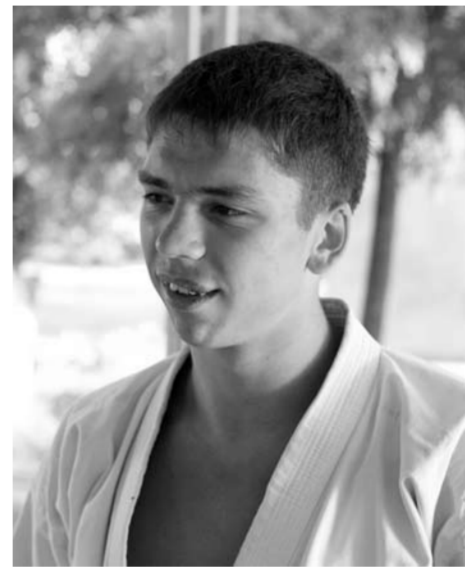
Главный плюс Тольятти в том, что город спокойный, тихий и уютный. Главный минус – здесь очень тускло. Явно не хватает парков и каких-то достопримечательностей.

С самого детства занимался карате, потом начал тренировать детей. Ког-