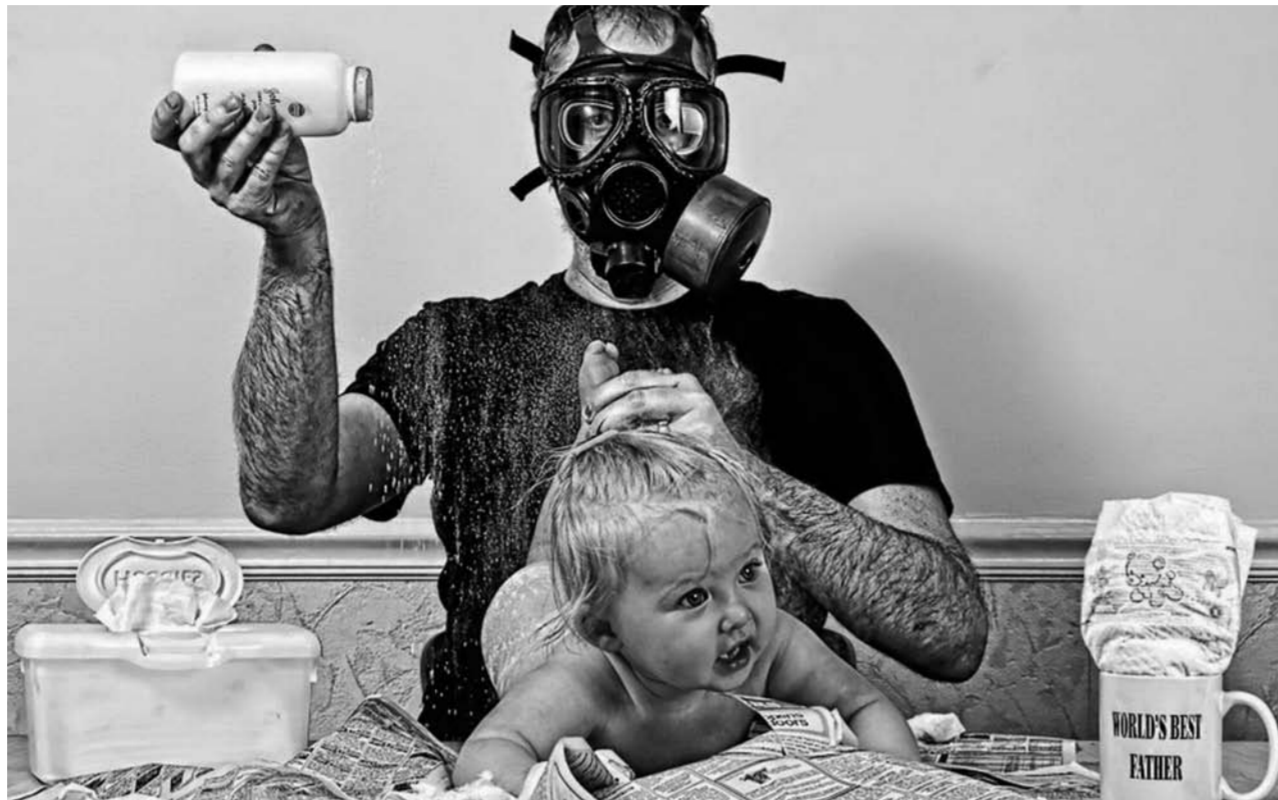
По результатам исследований, 39% российских мужчин, состоящих в браке, не исключают для себя возможности взять отпуск по уходу за ребенком вместо жены. Однако фактически в декрет уходят всего 2% пап.

Так, по результатам социологических опросов, проведенных исследовательским центром портала Superjob, 39% российских мужчин, состоящих в браке, не исключают для себя возможности взять отпуск по уходу за ребенком вместо жены.