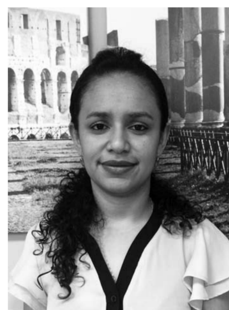
Привезла родителям из России матрешку, конфеты «Родные просторы» и семечки. Да, у нас есть подсолнухи, но семечки грызть не принято, и никто их никогда не пробовал.

Когда мы с подружкой отправились сюда, то практически ничего не знали о том, что за это страна, Россия, толком не представляли, где она находится. Приехали в Тольятти в начале мая. Думали, что будет холодно, и