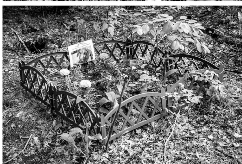
В Тольятти есть как минимум три крупных кладбища для домашних животных. Все они нелегально существуют уже много лет и находятся в лесопосадках каждого из районов города.

ных, чтобы хозяева могли достойно предать земле прах своих любимцев. В итоге никаких мер предпринято не было, и люди продолжают хоронить