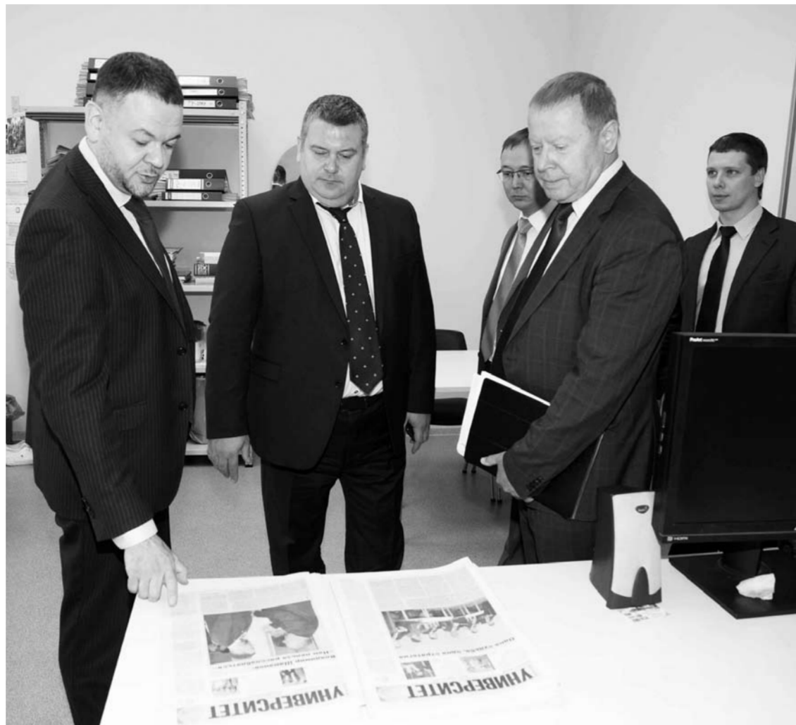
Тольяттинский государственный университет попал под пристальное внимание не только федерации, но и региона.

Программа развития университета включает ряд стратегических проектов и задач, которые будут реализованы в Тольятти и регио-