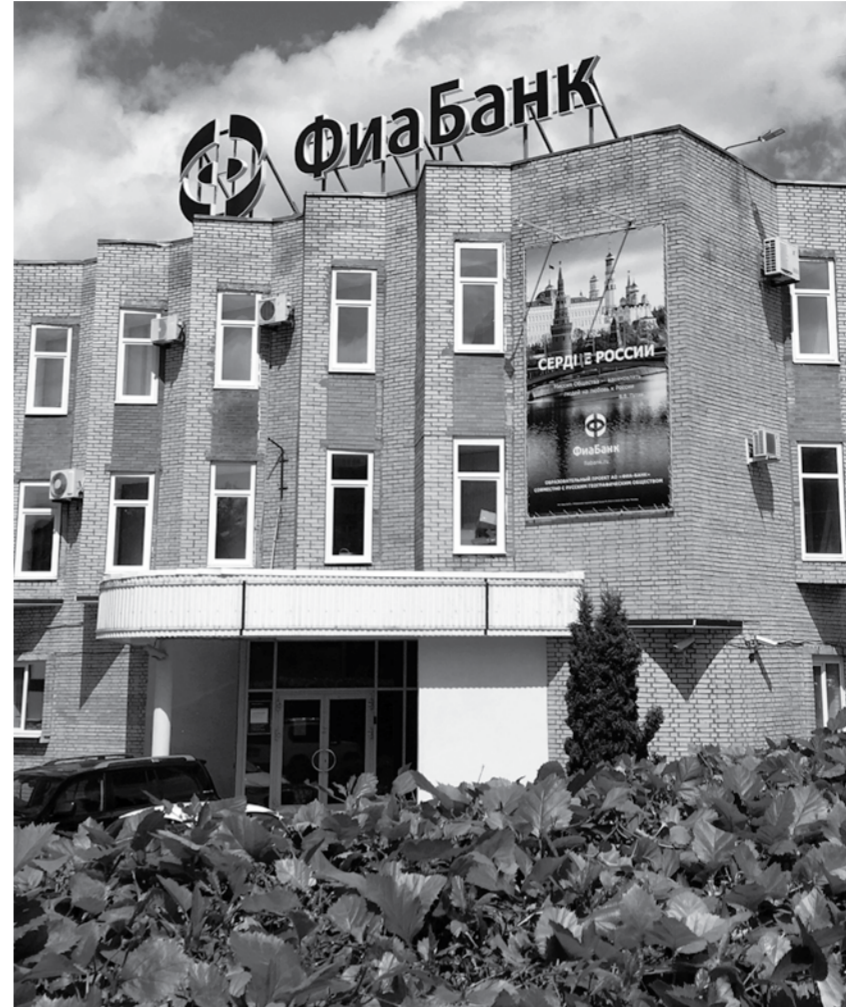
Самый крупный объект – земельный участок и нежилые помещения с имуществом по адресу: Новый проезд, 8, где ранее располагался ФиаБанк. Он оценен в 391,5 млн рублей.

зарегистрирован Эл банк. Недостроенные здания, нежилые помещения, жилые дома, гаражи, земельные участки, часть административного здания – все это