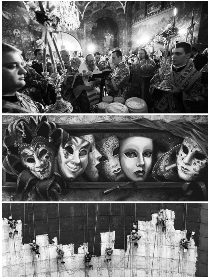
В Тольятти можно стать не только программистом, юристом или педагогом, но и получить редкую специальность – в городе учат будущих актеров, священнослужителей и альпинистов.

Учеба для будущего служителя Мельмолены – это постоянная практика. Каждый день мы выходим на сцену, ведь, как говорит наш преподаватель, «сидя на стуле, актер не станешь». Мало кто может похвастаться тем, что во время обучения непрерывно совершенствуется, а не только заучивает теорию. С каждым днем я открываю новые грани мастерства и свои способности. У нас, например, есть пластическое воспитание. И если бы год назад кто-то сказал,