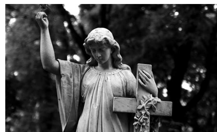
Стоимость земельного участка на Тольяттинском городском кладбище оценили в 133 млн рублей.

ИСТЕЦ: АДМИНИСТРАЦИЯ ТОЛЬЯТТИ ОТВЕТЧИК: ЗАО «НИВА» ПРЕДМЕТ СПОРА: КЛАДБИЩЕ И 7,4 МЛН РУБЛЕЙ