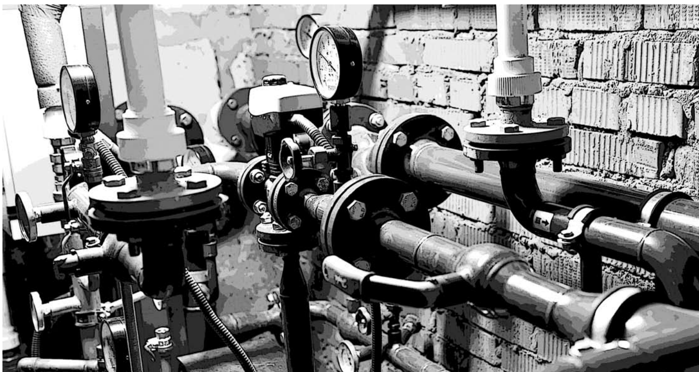
Изначально ТЭЦ ВАЗа, сети и поступающий по сетям энергоресурс были единым техническим комплексом. Когда комплекс разделили, стали возникать проблемы.

квартала. Также ухудшились параметры в домах трех других кварталов из-за некачественной услуги по подаче ГВС. От жильцов поступают многочисленные жалобы. В связи с этим прошу срочно решить вопрос о принятии необходимых мер для обеспечения рабочих режимов системы ГВС, в противном случае будем вынуждены