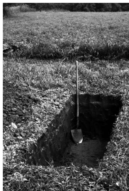
Из официально умерших в прошлом году 5,8 тыс. тольяттинцев захоронены на муниципальных кладбищах числятся только 3,6 тыс. Куда же делись еще 2,2 тыс.?

Судя по результатам опросов различных социологических служб, все больше россиян хотят, чтобы после смерти их тело было предано огненному погребению. 25% опрошенных выбирают кремацию, считая ее дешевой процедурой. Других пугает мысль, что их тело будет разлагаться в земле. А многие респонденты заявили, что предпочтут урну муниципальному кладбищу из-за царящего там уныния. В Тольятти крематория нет, зато кладбищенского уныния и разлуки – хоть отбавляй. Вот покойники и убегают.