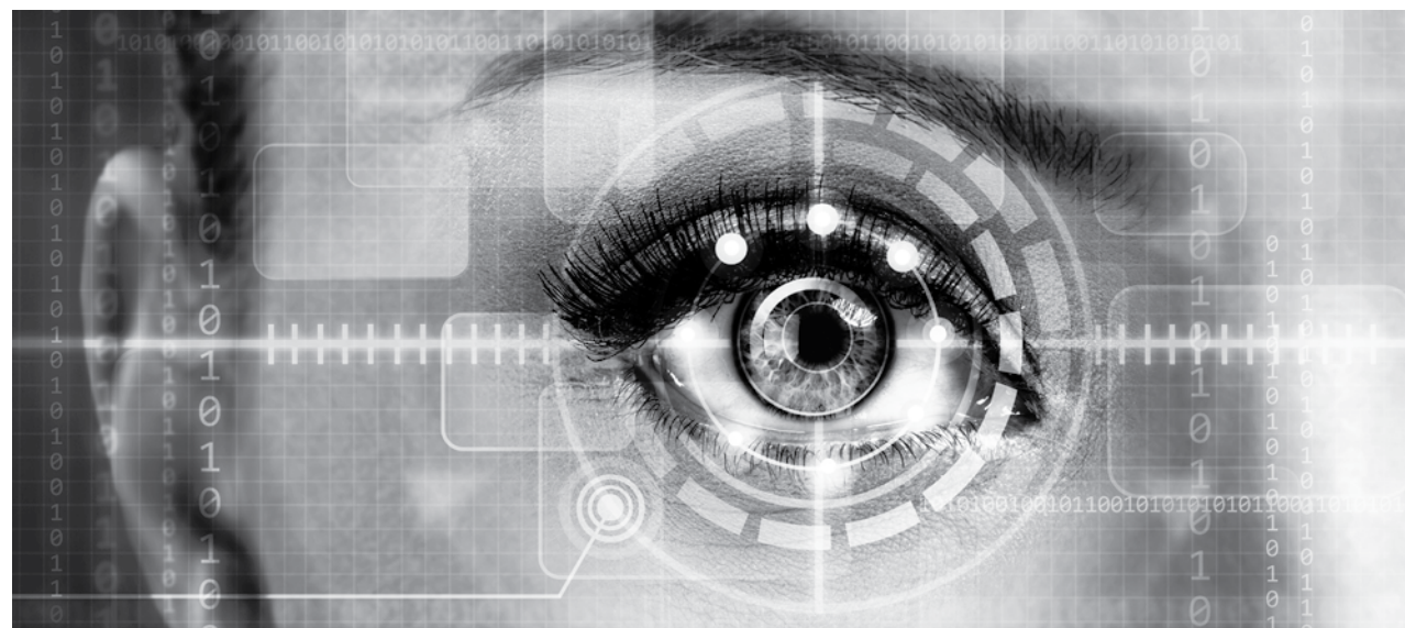
Умножьте возраст ребенка на два и прибавьте пять – именно столько минут он может непрерывно напрягать глаза без какого-либо ущерба. Для взрослых это время ограничивается часом.

Большинство людей, желая раз и навсегда избавиться от неудобств, связанных с постоянным ношением очков или контактных линз, решаются на лазерное восстановление зрения. Данная процедура с каждым годом набирает популярность, ведь проводится она достаточно быстро и безболезненно.