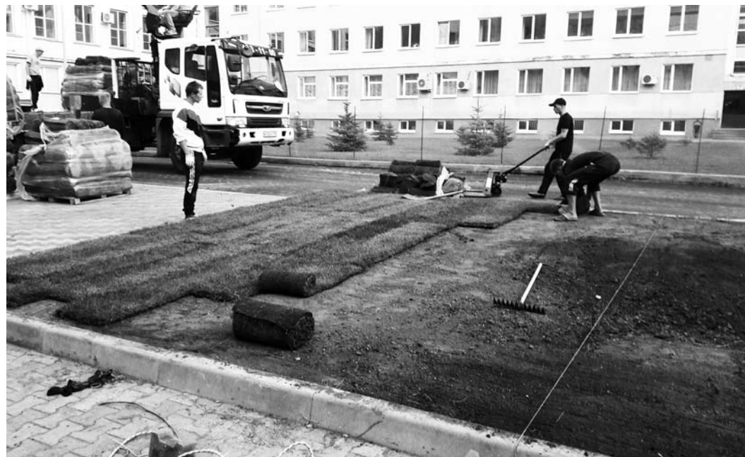
Что касается городского хозяйства, оно получит «подпитку» из областной казны. В этом году запланировано выделить из областного бюджета на комплексное благоустройство внутриквартальных территорий 126 млн рублей.

дополнительных средств – реорганизация. До 1 сентября в муниципальных учреждениях культуры нашего города пройдут преобразования, в ходе которых общая численность сотрудников должна сократиться до 1,116 тыс. человек. Вспомогательный и частично административно-управленческий персонал культурной отрасли (водители, охранники и т.д.) останется без повышения. При этом всех «лишних»