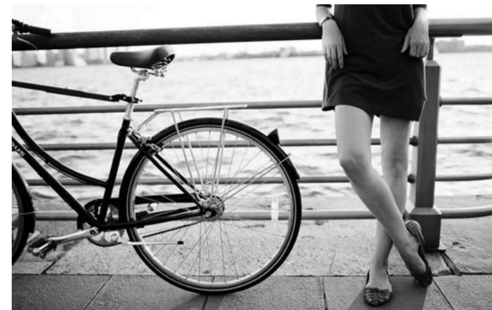
Стоимость аренды велосипеда в тольяттинских пунктах проката – 150 рублей. Роликовых коньков – 100 рублей. Гироскутера – 500 рублей.

В этом году лето не балует тольяттинцев жарой и солнцем. Зато свободное время можно проводить не на пляже или дома под кондиционером, а с пользой и активно. На помощь в этом придет сезонный транспорт. Однако если вы нечасто используете велосипед, ролики или иной спортивный инвентарь, его совсем не обязательно покупать. «ПН» узнал, во сколько обойдется аренда двухколесного транспорта и где можно взять на время гироскутера.