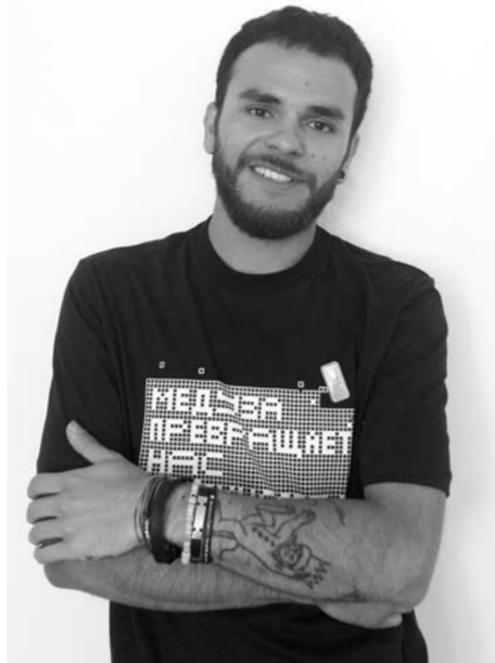
Тольяттинцы недоверчивые и закрытые, но, когда ты сам начинаешь открываться им, рассказывать о себе и делиться своими чувствами, они отвечают взаимностью. Все те, кого я здесь встретил, – замечательные люди.