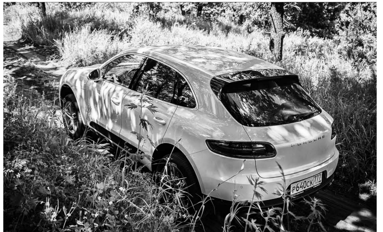
Сайенне, который многие ошибочно считают собратом премиального кроссовера, скорее его дядя, занимавшийся в юности бодибилдингом. Macan же создан на единой с Audi Q5 платформе и на деле весьма компактное авто. Но какого гедониста волнует данный факт?

только на гоночном треке. Активируя его, вы получаете максимум жесткости и постоянный форсаж, а плюс к этому перегазовку с пробуксовкой.