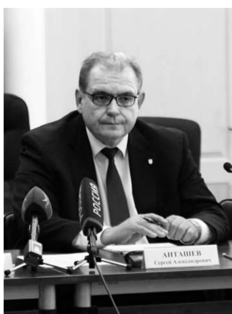
По словам главы города, управляющие фактически станут его заместителями, представляя муниципальную власть.

Что касается управляющих микрорайонами, то, по словам главы города, они