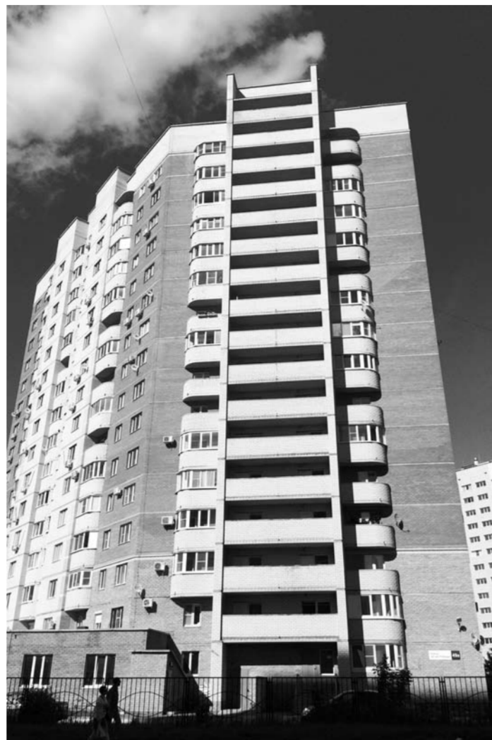
На сегодняшний день объем жилищного фонда Тольятти составляет около 16 млн кв. м. Согласно действующему генеральному плану, к 2025 году этот показатель должен вырасти еще на 4 млн «квадратов» жилья.

Квартиры в Тольятти стоят значительно дешевле, чем в Самаре, и предложений к продаже вторичного жилья у нас в 3,5 раза больше, чем в областной столице. Согласно данным, полученным в ходе анализа, в Тольятти продается более 5 тыс. квартир, тогда как в Самаре количество предложений едва достигает полтора тысяч. Месяцем ранее Самарский областной фонд жилья и ипотеки, проанализировав все уникальные предложения, размещенные в откры-