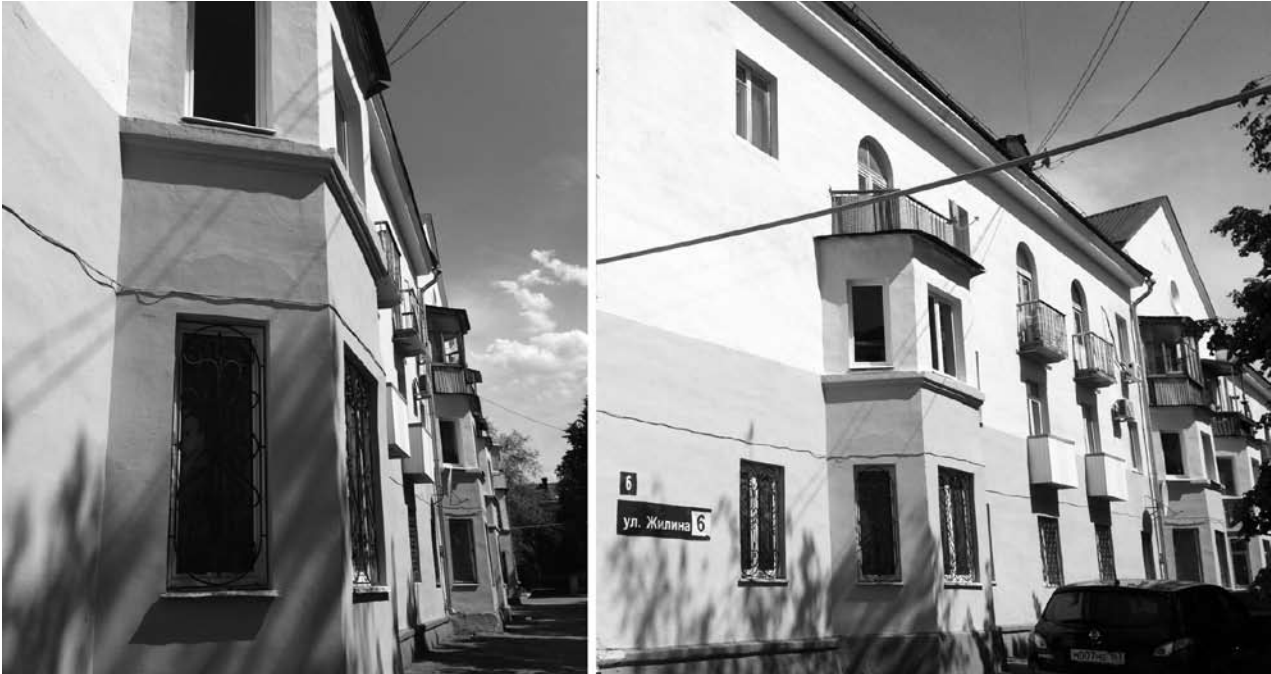
❶ Дом на Жилина, 6, характеризует развитие Тольятти в целом и сообщает о том, что город тогда рос ураганными темпами. В течение 50-х годов один за другим принимались генпланы застройки города, где количество населения в каждом следующем проекте разительно отличалось от предыдущего.

Застройщиком дома выступал хозяйственный отдел УМВД, подрядчиком – строительное управ-