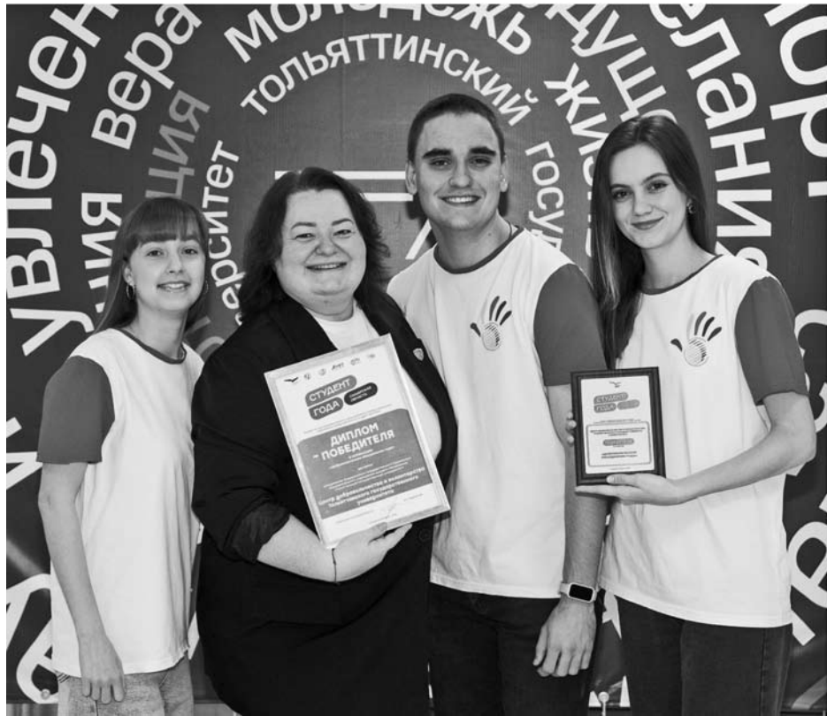
В ТГУ уверены, что волонтерство может быть ярким, современным и по-настоящему крутым.

Вместе с ней на очном этапе, где за победу боролись восемь лучших