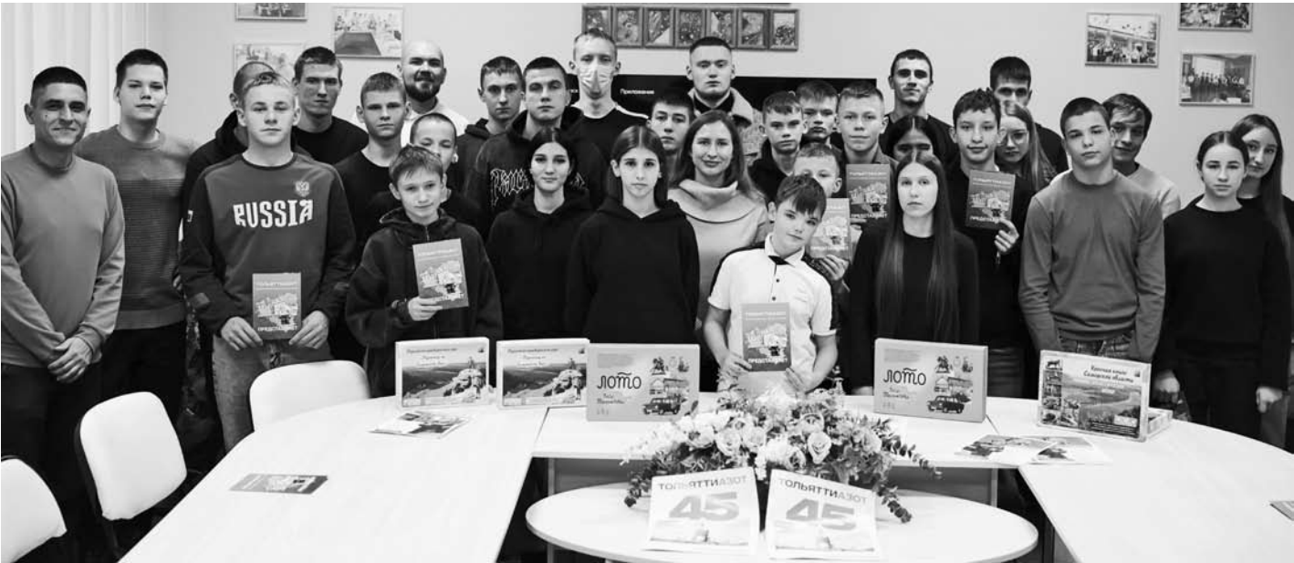
Для полного погружения в специфику химического производства были продемонстрированы презентационные видеоролики – о предприятии, его продукции и наиболее востребованных специальностях. По итогам встречи с воспитанниками центра «Единство» была проведена интерактивная викторина, победители которой получили призы.

ТОАЗ провел профориентационную встречу в центре «Единство»