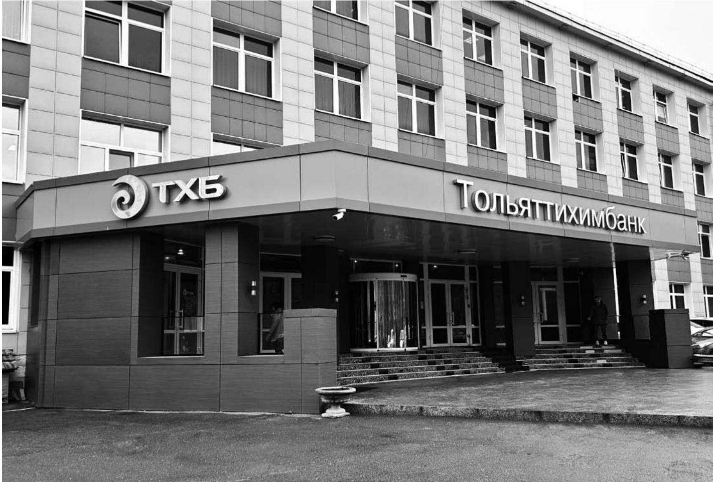
Специалисты АКРА выделили высокий уровень кредитоспособности и достаточности капитала Тольяттихимбанка.

фондированию и ликвидности. Кроме того, АКРА