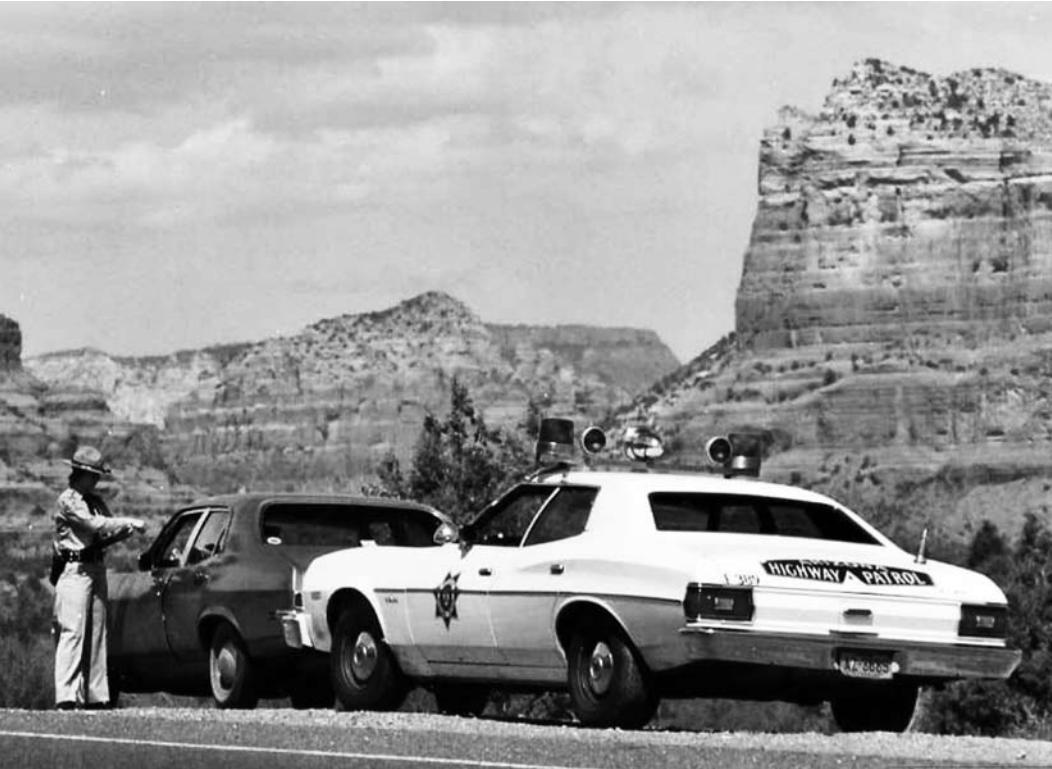
Если в автомобильной погоне верх взяло мастерство офицеров, то в пешей победу одержала молодость. Пока тольяттинские полицейские покидали служебный автомобиль, юные нарушители попросту «исчезли с радаров».

Мужчина подделал документы, в том числе сертификат на должность командира воздушного судна, и «выполнял обязанности» в литовской авиакомпании Avion Express в течение довольно длительного