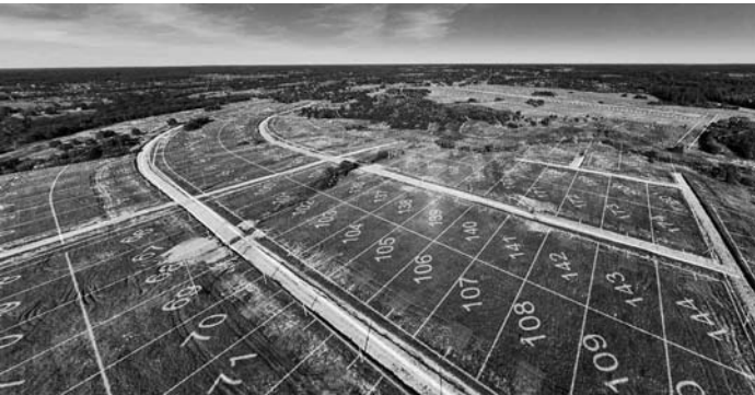
В течение года участок площадью 100 гектаров был разделен на пять наделов, которые были переданы близким глава КФХ. Новые владельцы перепродали эти участки аффилированным лицам.

При этом глава КФХ действовал оперативно, но не в сфере развития сельского хозяйства, а в вопросах переоформления прав собственности. Судя по его дальнейшим действиям, полученный земельный участок рассматривался им не как средство производства, а как личное имущество, подлежащее распределению между родственника-