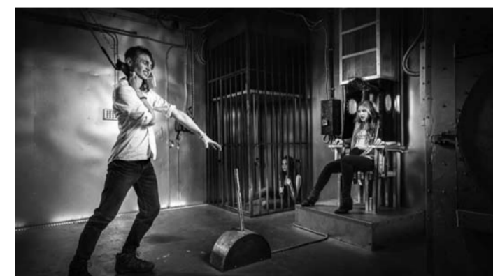
В Тольятти можно пройти обычный квест формата escape the room или выбрать игру с участием живых актеров. А можно устроить квест на свежем воздухе или разнообразить им свадебное торжество.

В Тольятти искать место, где можно пройти обычную игру формата escape the room или выбрать игру с участием живых актеров. А можно устроить квест на свежем воздухе или разнообразить им свадебное торжество. манс «Амнезия». Итак, вы – группа журналистов в погоне за сенсационным сюжетом – приехали тайком от всех в дом маленькой девочки, где происходят необъяснимые вещи. Девочка живет с отчимом-двоемном, который практически перестал обращать на нее внимание и все время проводит в своем кабинете. Когда девочка спрашивает мужчину о том, чем он занимается – получает пощечину. Раздается крик, дверь захлопывается. Ваша задача – за полчаса подружиться с девочкой, узнать, что происходит, и не стать жертвой отчима. Стоимость игры – 3–3,5 тыс. рублей. РЕЖИМ «ЖЕСТЬ» Если вы не любители разгадывать загадки, решать головоломки и отгадывать