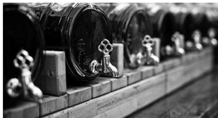
По данным департамента регулирования оборота алкогольной продукции Самарской области, самым потребляемым напитком в регионе в 2011 году являлось столовое плодородное вино местного производства.

Оставшись без кредитных средств, винзавод