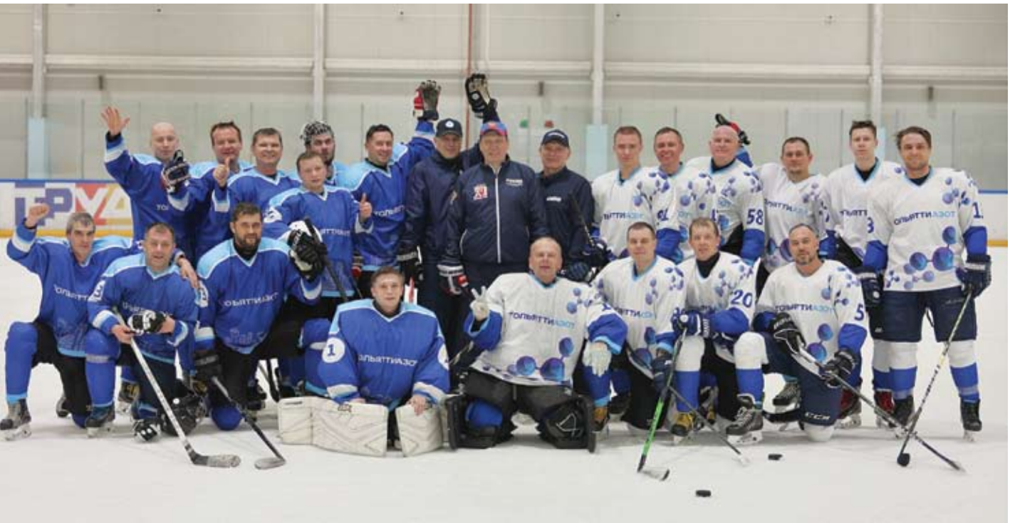
Евгений Давыдов, олимпийский чемпион: «Команда «Тольяттиазот» демонстрирует серьезный уровень подготовки и высокую мотивацию. Приятно видеть, как крупное предприятие вкладывается в развитие корпоративного спорта, создавая все условия для своих сотрудников».

Мастер-класс для игроков ХК «Тольяттиазот» провел олимпийский чемпион Евгений Давыдов