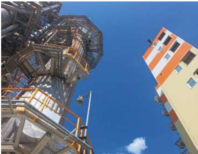
«КуйбышевАзот» – в числе компаний, приносящих максимальную пользу обществу при минимальном воздействии на окружающую среду.

ритория «Ставропольский сосняк». Эта история для компании стала продолжением многолетней работы по спасению тольяттинского леса, где с 2012 года силами сотрудников уже восстановлено более 60 га, на которых высажено более 300 тыс. молодых деревьев. Давая оценку ответственности ПАО «КуйбышевАзот» перед обществом,