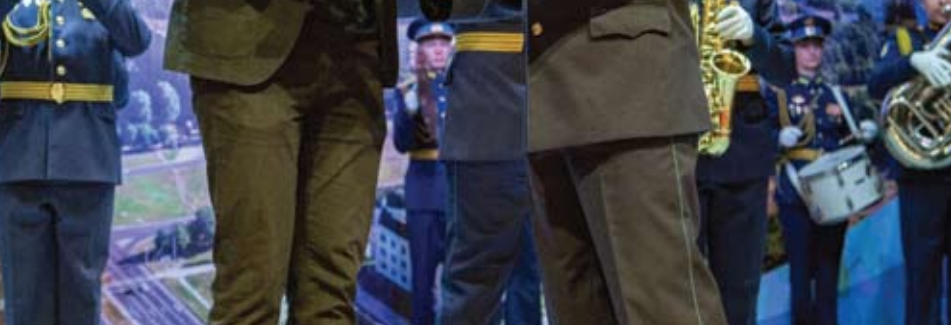
Мероприятие «Плечом к плечу» стало той самой живой точкой пересечения, где встретились те, кто помогает, и те, кто обеспечивает доставку этой помощи. Инициатором и организатором вечера выступила компания «АВТОВАЗТРАНС» в статусе главного перевозчика гуманитарных грузов региона.

С начала специальной военной операции перед АО