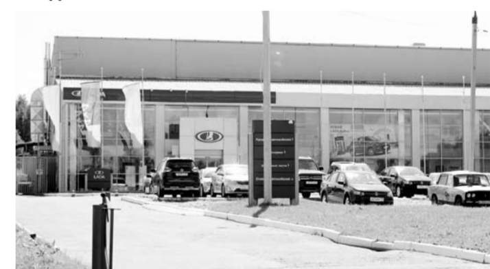
В 2014 году Сбербанк выдал ООО «Тверь-Авто» (связано с «Лада Стиль») кредит на 90 млн рублей. Обеспечением выступило то же самое имущество – здание автосалона и земельный участок.

ИСТЕЦ: ООО «ДИМИТРОВГРАДСКИЙ АКЦЕПТНЫЙ ДОМ» ОТВЕТЧИК: ООО «ЛАДА СТИЛЬ» ПРЕДМЕТ СПОРА: АВТОСАЛОН В ТВЕРИ