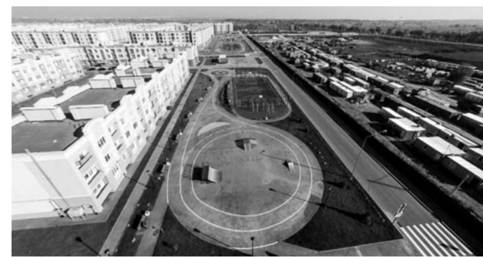
19 октября одиннадцатый апелляционный суд оставил без изменения первое постановление самарского арбитража о взыскании с ООО «С.И.Т.И.» в пользу СОФЖИ 43 млн рублей.

ИСТЕЦ: СОФЖИ ОТВЕТЧИК: ООО «С.И.Т.И.» ПРЕДМЕТ СПОРА: 43 МЛН РУБЛЕЙ