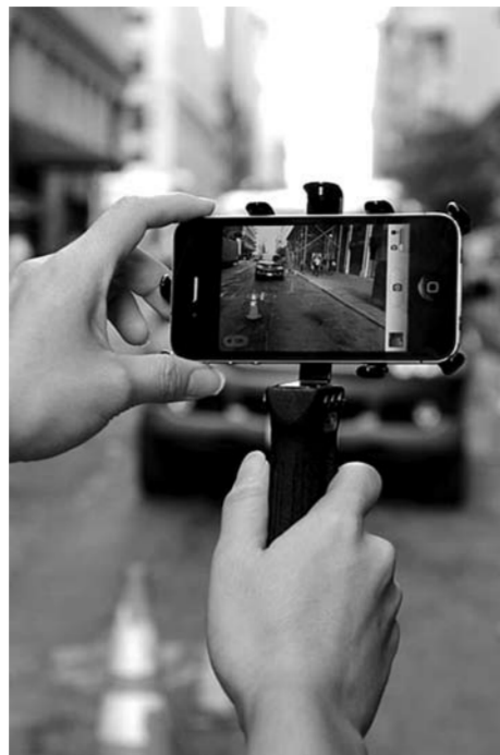
Теперь социально активные граждане, зафиксировавшие нарушения с помощью смартфона или видеорегистрации, смогут наказать недобросовестного водителя, всего лишь правильно оформив жалобу.

В России появится институт «народных инспекторов», благодаря которому следить за ситуацией на дорогах и фиксировать нарушения смогут обычные граждане. В рамках инициативы правительство РФ предлагает выделить отдельные нарушения ПДД, постановления о наказаниях за которые смогут выноситься без составления протокола. При этом фиксировать нарушения бдительные россияне смогут сами.