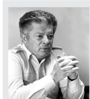
Святослав Николаевич Федоров — один из выдающихся офтальмологов современности, глазной микрохирург, профессор. Действительный член Российской академии медицинских наук (РАМН). Являлся членом-корреспондентом Российской академии наук (РАН), действительным членом Российской академии естественных наук (РАЕН), ряда зарубежных академий.

Клиника ведет обширную научную деятельность по лечению различных глазных заболеваний. В филиале работают профессор, четыре доктора медицинских наук, 12 кандидатов медицинских наук, 40 врачей высшей категории. Получить консультацию высококлассных опытных специалистов можно прямо в Тольятти, в «Центре зрения», который более 20 лет является партнером чебоксарского филиала и имеет множество награ-