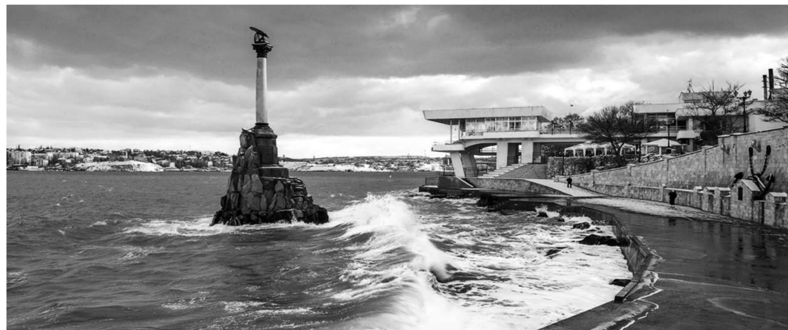
«Крым — это хорошая точка роста, — рассказывает тольяттинский бизнесмен. — Вся «поляна» пустая, и есть своя специфика: из-за того, что нет нормального сообщения, все, что производится внутри этой территории, имеет конкурентное преимущество».

Еще один пример: тольяттинские предприниматели