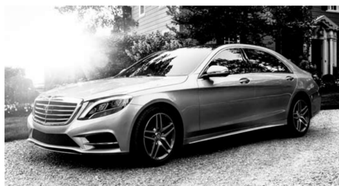
«Индекс расточительности» возглавил автомобиль для ООО СК «ВТБ Страхование» из Москвы, которая принадлежит ПАО «ВТБ». Компания заказала себе Mercedes-Benz S-Class S 560 4Matic стоимостью почти 11,3 млн рублей.

Красиво жить не запретишь — об этом просто невозможно не думать, наблюдая за приобретениями российских компаний. Антикоррупционный проект Общероссийского народного фронта (ОНФ) «За честные закупки» представил «Индекс расточительности» за 2017 год, составленный из дорогих автомобилей, приобретаемых госкомпаниями. В числе расточителей оказались четыре предприятия Самарской области.