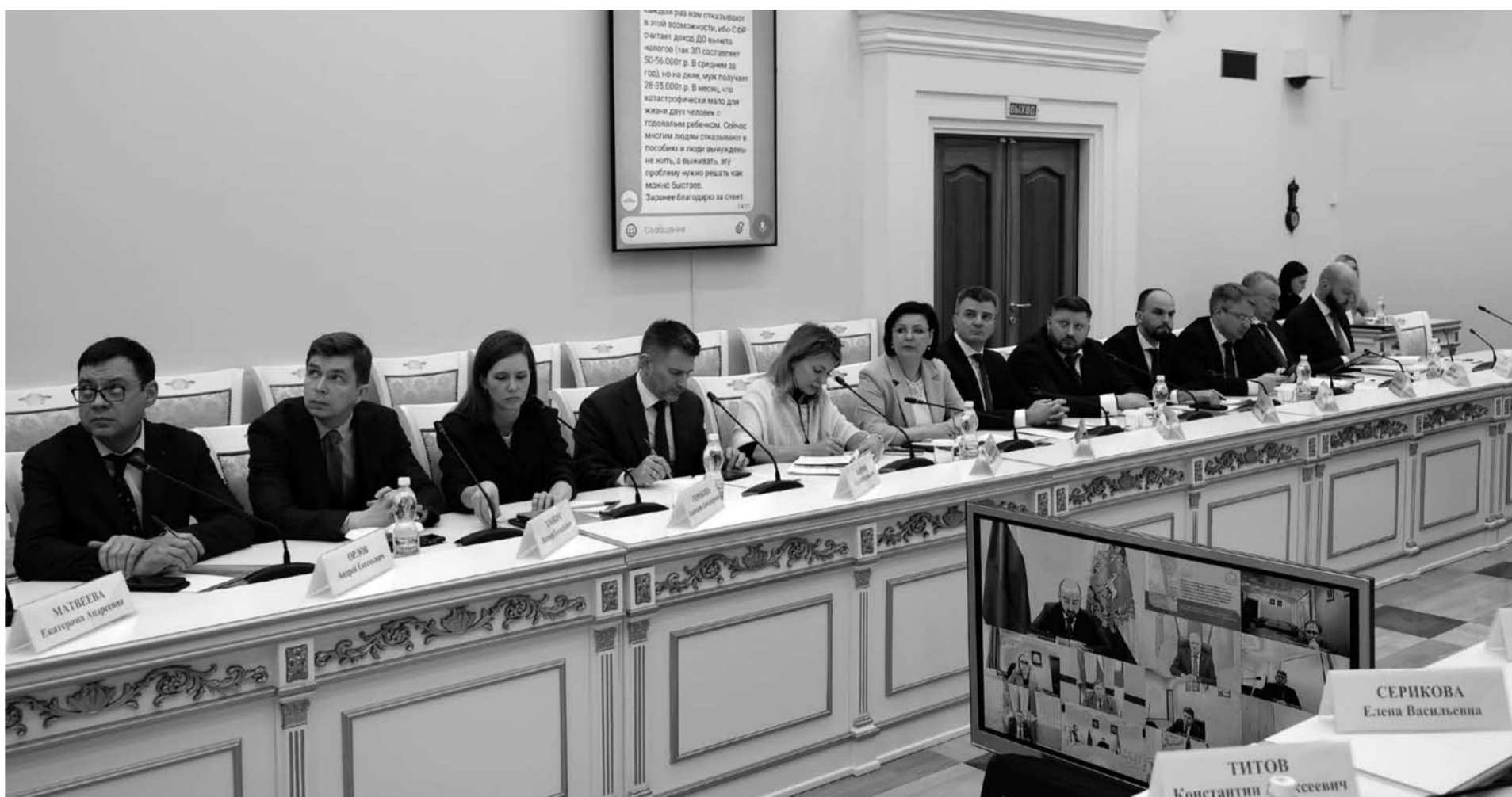
Одной из тем обсуждения стала работа областной системы здравоохранения. В частности, речь шла об ускорении и оптимизации процесса приобретения жизненно необходимых лекарственных препаратов для жителей региона. Губернатор поручил министерству здравоохранения сделать закупку лекарств оперативной и прозрачной.

вание в Самаре и поселке городского типа Безенчук.