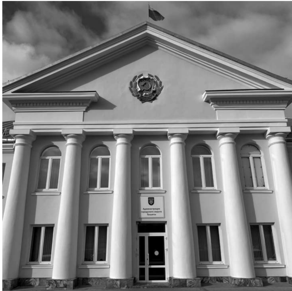
В 2025 году город выделяет 245 млн рублей на благоустройство тольяттинских жилых кварталов – дворов, общественных скверов и бульваров. Каждый из 35 избирательных округов получит на эти цели по 7 млн рублей – рекордно большую сумму за все годы работы этой городской программы.

менения в бюджет, обусловленные опережающим ростом сборов по подоходному налогу по сравнению с тем показателем, который заложили при формировании предыдущего бюджет-