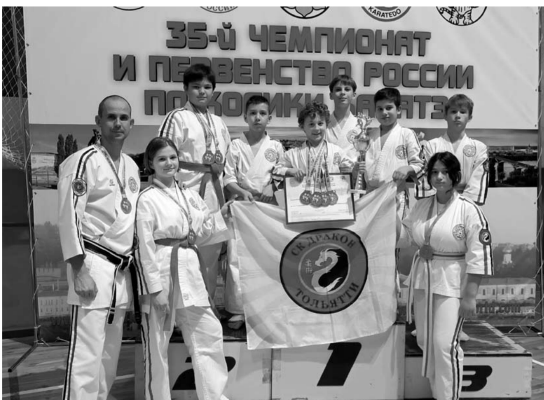
Участниками чемпионата России в Нижнем Новгороде стали 400 спортсменов из разных уголков страны. Тем приятнее, что в командном зачете победу отразодвала сборная Самарской области, ключевой вклад в успех внесли воспитанники тольяттинского спортклуба «Дракон».

На излете минувшего года прошел уже 35-й по счету чемпионат страны по косики каратэ. То есть чемпионы истоками соревнования восходят ко временам Советского Союза, где каратэ долгое время находилось под запретом. Впрочем, многолетние гонения не помешали советским бойцам довольно быстро показать, кто на татами хозяин – даже на самых престижных соревнованиях в Японии. И как раз лучшие традиции единоборства с тех самых совет-