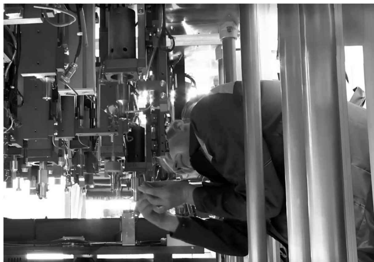
Разработкой практических кейсов для АО «АВТОВАЗ» студенты ТГУ занимаются в рамках новой сквозной дисциплины «Инженерная подготовка». Ее включили в учебную программу обучающихся 1–4 курсов института машиностроения ТГУ в осеннем семестре 2024/2025 учебного года благодаря Передовой инженерной школе «ГибридТех». Все проекты регистрируются на разработанной в ТГУ цифровой платформе «Проектива», где по итогам выполнения задач студенты получают оценку по дисциплине «Инженерная подготовка».