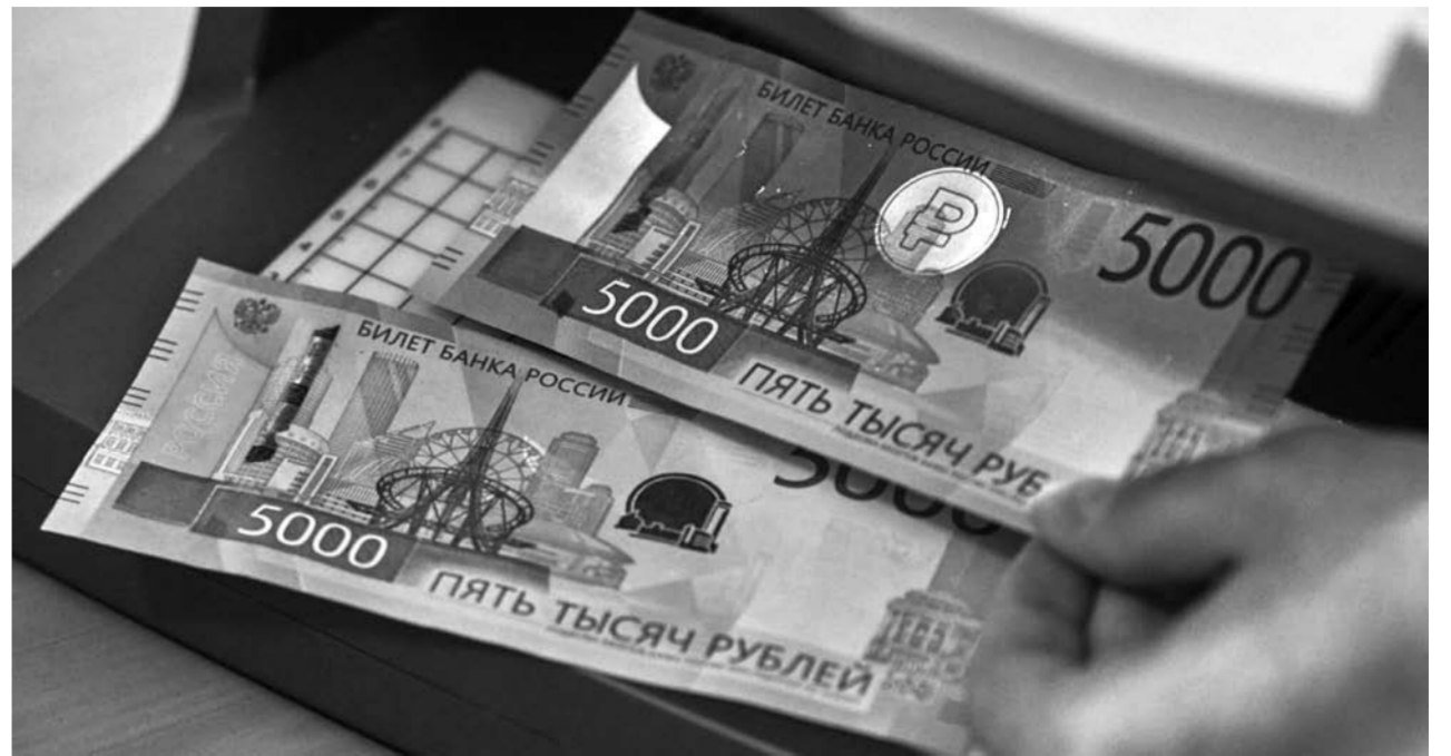
В январе полная стоимость автокредита со всеми комиссиями и платежами у ВТБ колеблется в пределах от 23,46 до 35% годовых. У Т-Банка — от 22,89 до 28,99%. В Сбере — 26,4–41,33% годовых. В итоге потребитель может заплатить за машину даже три ее цены.