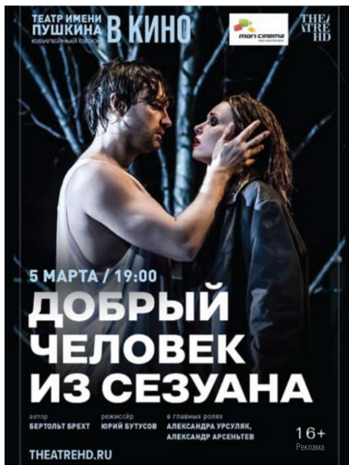
Театр в кино! Не пропустите известные театральные постановки на большом экране в «Мори Синема» Тольятти! Автозаводское шоссе, 6. ТРК «Парк Хаус». Билеты уже в продаже!