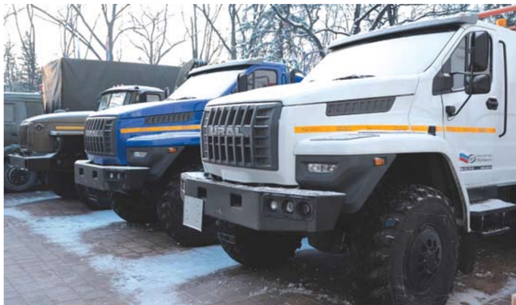
В этот раз на фронт отправились три специализированных автомобиля «Урал». «Комплектующие, колеса – сделайте список всего, что может выходить из строя, чтобы мы могли обеспечить замену», – сказал глава региона.

Но главное, для фронта были закуплены и отправлены в воинские части три сотни квадрокоптеров