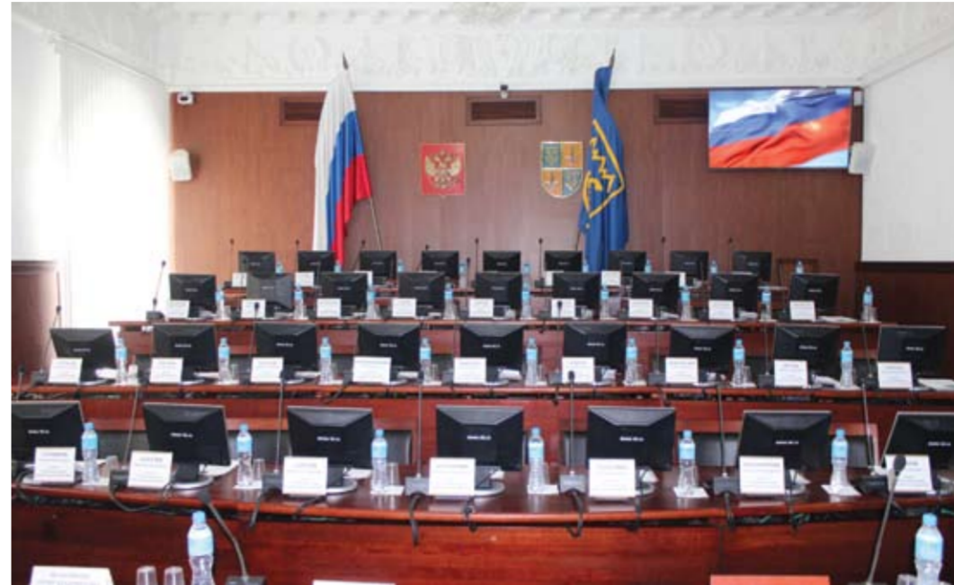
Процедура определения нового градоначальника Тольятти затянулась сверх всякой меры. Конкурс на замещение вакантной должности был объявлен решением Тольяттинской городской думы еще в октябре 2024 года.

перенесли. Председатель ТГД Рузанов так прокомментировал решение: «Это обусловлено большим количеством кандидатов на должность главы Тольятти и необходимостью допол-