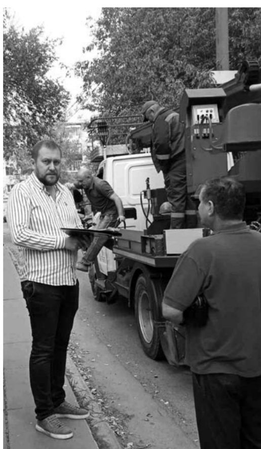
Руководство АО «ПО КХ г. о. Тольятти» прилагает значительные усилия в совершенствовании организации работы по охране труда.

Уже не первый год руководство предприятия прилагает значительные усилия в совершенствовании организации работы