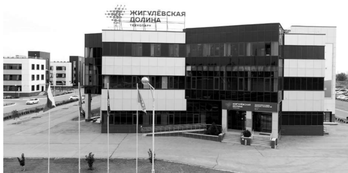
На данный момент 45 самарских компаний получают налоговые льготы, гранты и другие преференции как участники проекта «Сколково». С 2018 года региональным оператором Фонда «Сколково» в Самарской области является технопарк «Жигулевская долина» совместно с СамГМУ.

Фонд также подписал соглашение с Самарским государственным медицинским университетом, которое позволило усилить взаимодействие по развитию стартапов СамГМУ и проводить совместные акселерационные программы. У стартапов фонда появилась возможность использовать ре-