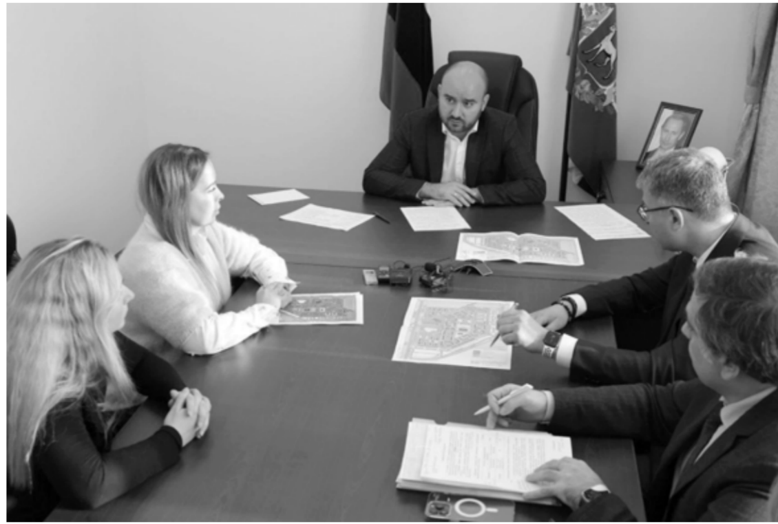
Вопросы, которые подняли жители Тольятти и Новокуйбышевска во время личного приема у губернатора, касались строительства детского сада и новой школы в тольяттинском микрорайоне Калина, обеспечения выезда на улицу Полякова, а также решения кадровых вопросов и реконструкции Новокуйбышевской спортивной школы олимпийского резерва. «Спасибо огромное за помощь и принятые решения», – поблагодарили участники встречи Вячеслава Федорищева.

Но все же транспортная проблема микрорайона требует решения. В данный момент администрацией города прорабатывается вопрос строительства выезда с территории ЖК «Южный бульвар» до улицы Полякова между автозаправочной станцией и домом № 24. Готовятся