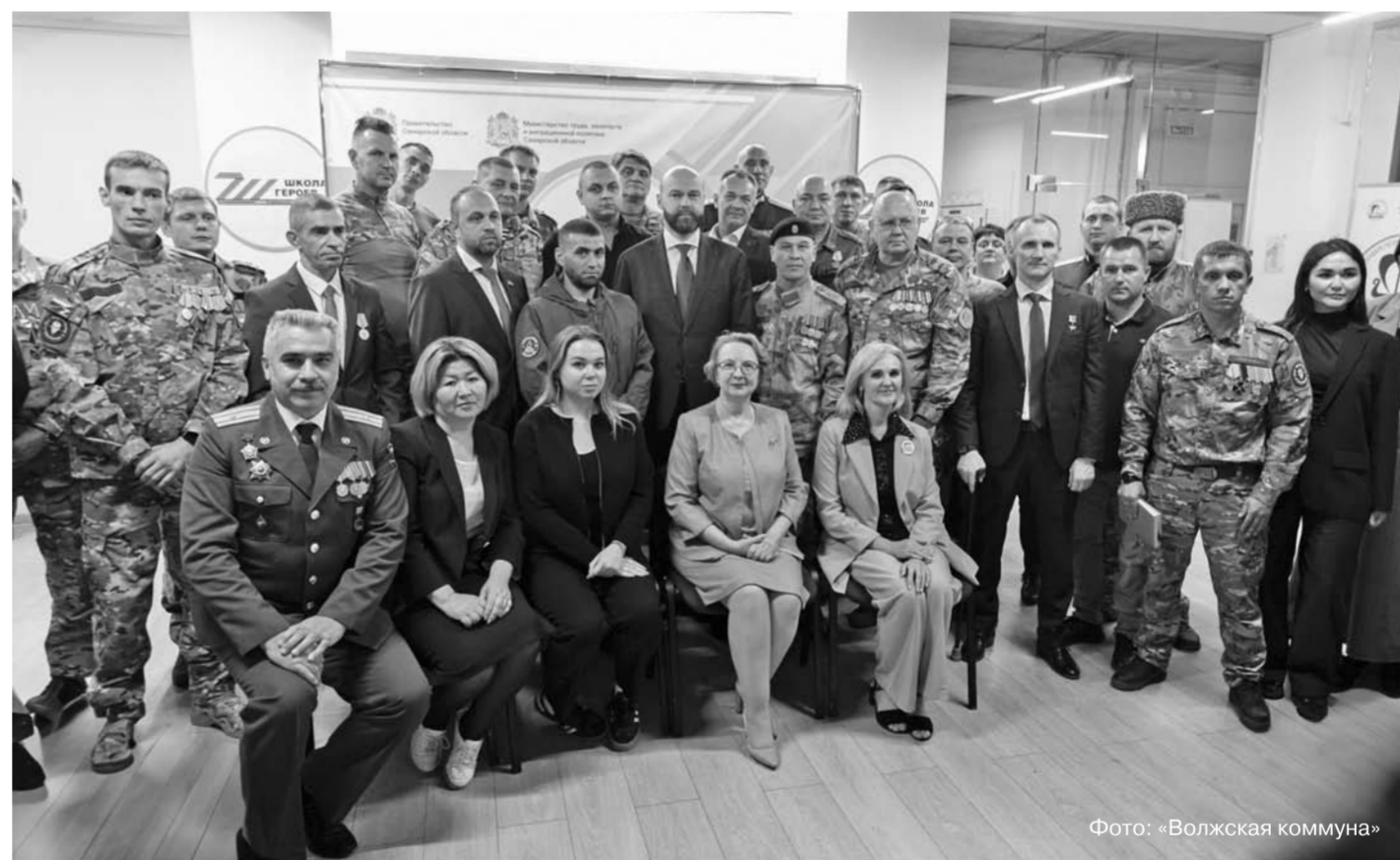
Цель «Школы героев» – формирование кадрового потенциала руководителей органов государственной и муниципальной власти, а также государственных компаний из числа участников специальной военной операции.

в представительных или законодательных органах власти. «В случае избрания планирую заниматься или