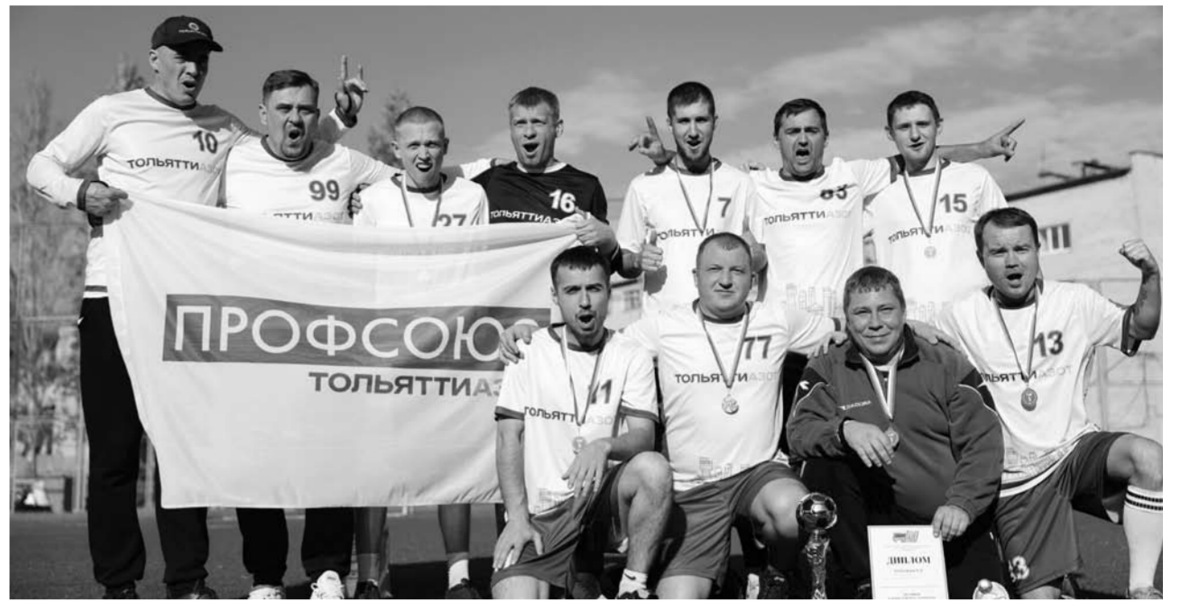
Завершившийся на днях областной турнир по футболу, приуроченный ко Дню машиностроителя, объединил шесть сильнейших корпоративных команд региона. Проведя четыре матча, команда «Тольяттиазот» заняла первую ступень пьедестала.

такиада же стала еще одной возможностью продемонстрировать высокие достижения в спорте и показать лучший результат среди сильнейших».