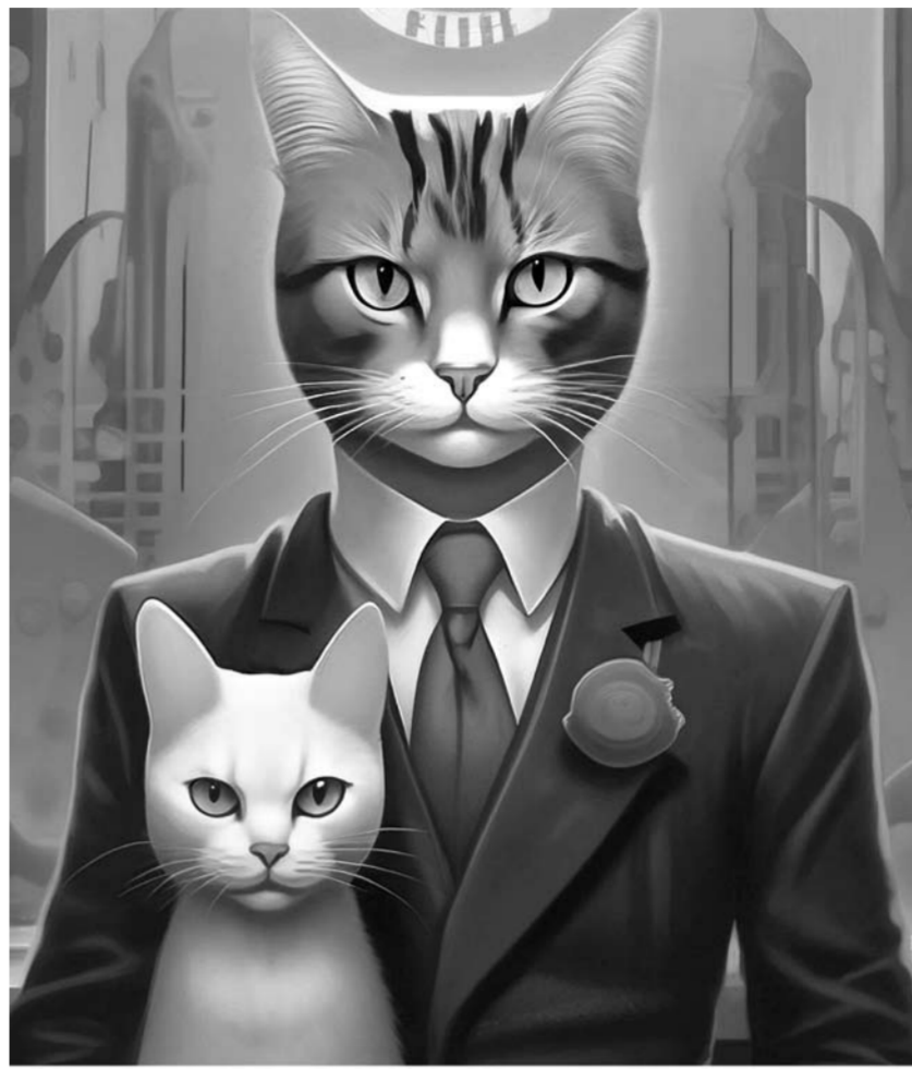
Омич без особого труда отучил свою дочь квадروبинга. Первым делом он забрал у нее телефон и планшет, так как животные этим не пользуются, а вместо гаджетов купил ей кошачий корм и лоток. Спустя четыре часа девочка сообщила, что больше не хочет быть кошкой.

Первым делом папа забрал у нее телефон и планшет, так как животные этим не пользуются. Вместо гаджетов он купил дочке кошачий корм и лоток, которые поставил в кладовку — новую комнату для «кошки». Спустя четыре часа девочка сообщила,