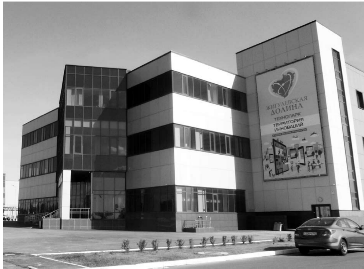
На высокие оценки в рейтинге во многом влияют комфортные условия, созданные для инновационного и технологического бизнеса региона. Так, технопарк в сфере высоких технологий «Жигулевская долина» вошел в тройку лучших технопарков страны, заняв второе место по итогам 2023 года.

в тройку лучших технопарков страны, заняв второе место по итогам 2023 года. Сегодня его