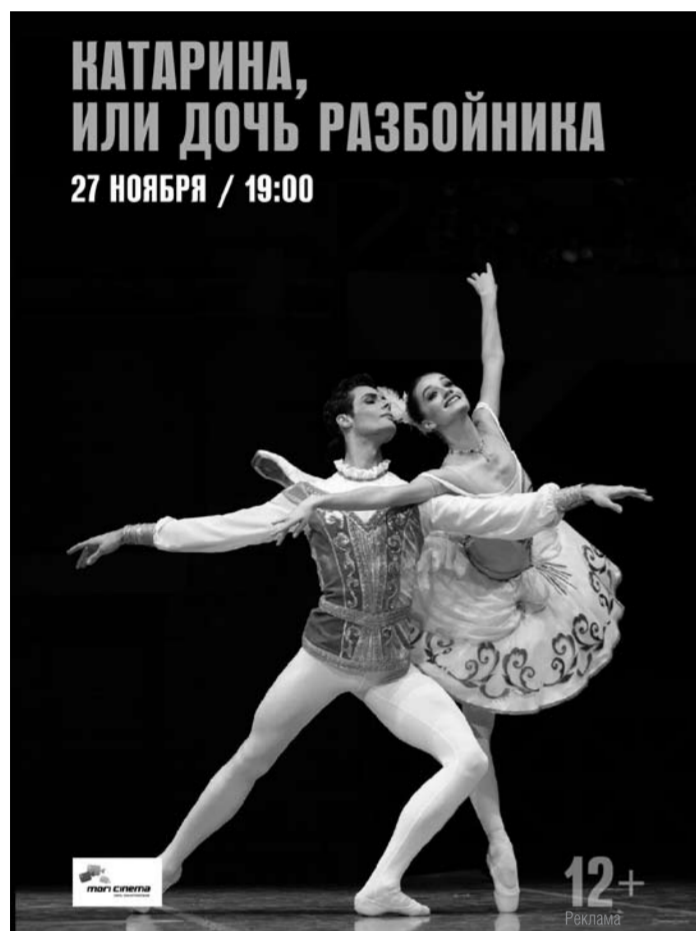
Театр в кино! Не пропусти известные театральные постановки на большом экране в «Мори Синема» Тольятти! Автозаводское шоссе, 6. ТРК «Парк Хаус». Билеты уже в продаже!