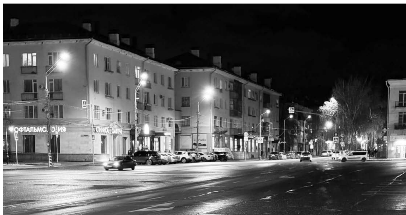
В 2024 году сотрудниками предприятия выполнены работы по замене старых светильников светодиодными на улицах Коммунистической, Победы, Комсомольской и Карла Маркса.

АО «ПО КХ г.о. Тольятти» делает город комфортным и безопасным