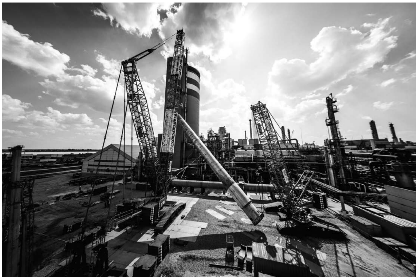
Ремонт на агрегате по производству карбамида № 1 проводится по уникальной технологии, разработанной с учетом габаритов реактора, который представляет собой колонну высотой около 40 метров, весом более 250 тонн и с оболочкой из стали толщиной 95 миллиметров.

Чтобы продлить срок эксплуатации главного аппарата производства карбамида