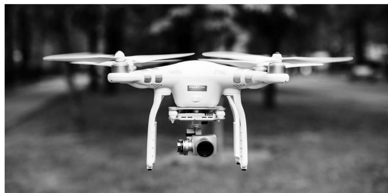
В Самарской области право на налоговый вычет имеют субъекты малого предпринимательства, которые реализуют инвестиционные проекты, и при этом основным видом их деятельности является производство летательных аппаратов.

На данный момент компании вправе снижать налог на при-